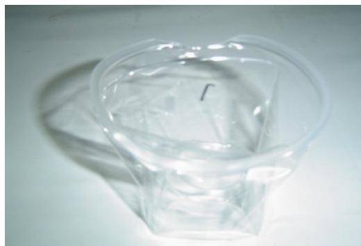
Gambar 9. Cacat penvok