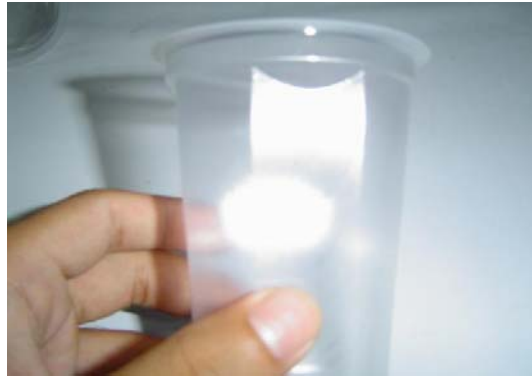
Gambar 7. Jenis cacat buram