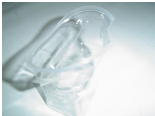
Gambar 8. Jenis cacat bibir Cup bergelombang