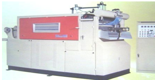
Gambar 5. Plastic Cup Making Machine RXC-660