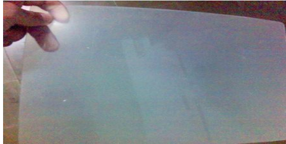
Gambar 3. Polypropylene dalam bentuk