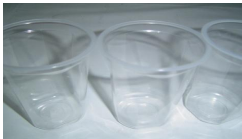
Gambar 1. Produk Cup S-250