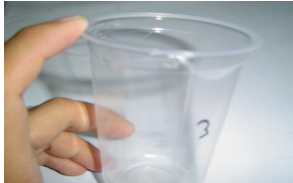
Gambar 10. Jenis cacat cacat menempel dengan cup lain

Cacat ini disebabkan karena settingan temperaturnya yang kurang baik. Jika temperatur terlalu panas dan bahan baku tidak mendukung maka hasil produksi akan menjadi tidak baik atau mengalami cacat.