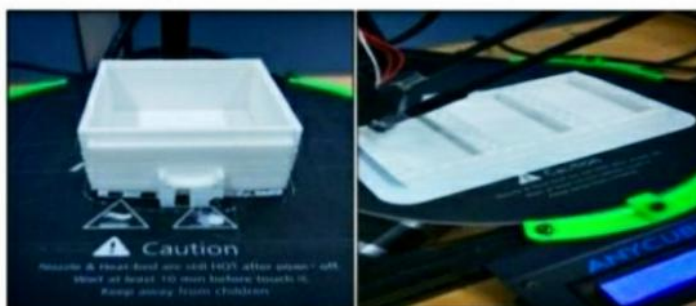
Gambar 5. Proses 3D Printing

Berbeda dengan proses pembuatan rangka dan badan dispenser, proses pembuatan kotak obat dilakukan menggunakan additive manufacturing atau 3D Printing. Pembuatan kotak obat dengan 3D printing ini menggunakan material bahan filamen PLA (Gambar 5).