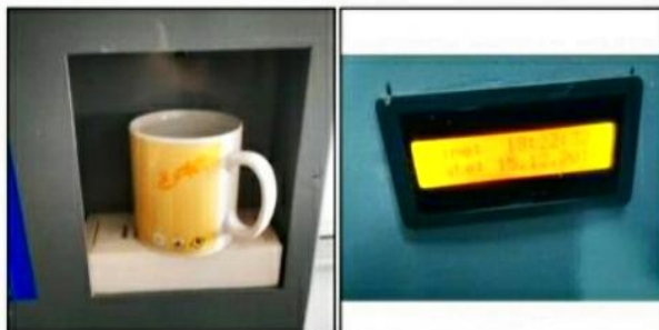
Gambar 7. Pengujian Prototype

Dalam pengujian teknis untuk prototype Kotak Obat dilengkapi Dispenser (Gambar 7), pengujian dinyatakan berhasil karena berhasil dalam menampilkan waktu dan tanggal secara real time , pengeluaran air dari selang yang bersumber dari galon air hingga menuju dip tray dan penyimpanan obat-obatan pada kotak obat.