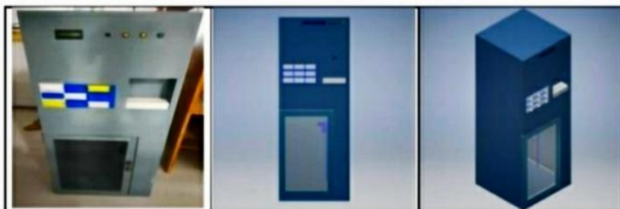
Gambar 6. Prototype Dispenser

Setelah seluruh komponen telah selesai dibuat maka dilakukan proses assembling antara komponen pada rangka yang sudah dibuat sesuai dengan desain yang telah dibuat yang dapat dilihat pada Gambar 6.