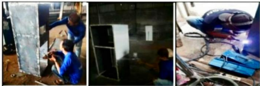
Gambar 4. Proses Perbengkelan

Dalam proses pembuatan rangka dan badan dari dispenser dilakukan beberapa tahapan. Tahapan pertama adalah pengukuran dan pemotongan bahan-bahan seperti plat besi, batang hollow steel , dan akrilik untuk pintu. Setelah semua bahan sudah dipotong dan dimensinya sudah sesuai dengan desain, maka langkah selanjutnya adalah penyusunan dan penyambungan rangka badan dengan mengelas batang hollow steel . Setelah rangka sudah tersusun dan tersambung, berikutnya case dispenser disambungkan pada rangka juga dengan pengelasan. Teknik pengelasan yang digunakan adalah las argon. Berikutnya, pemasangan pintu yang disambungkan dengan engsel yang diakhiri dengan proses pengecatan (Gambar 4).