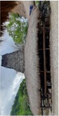
8. UMA TABINA WAWA