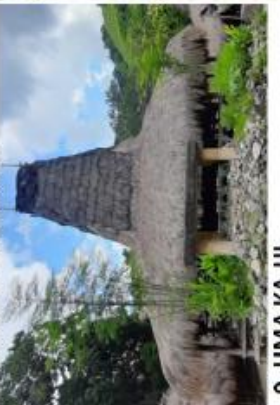
9. UMA KA-HI