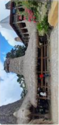
7. UMA TABINA DETA