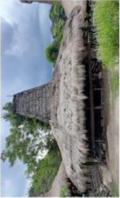
4. UMA TARIBANG