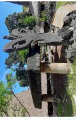
a. BATU MEGALITIK KAJIWA