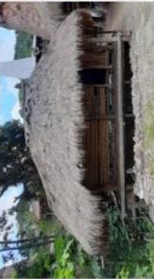
6. UMA MAWU JIRIK