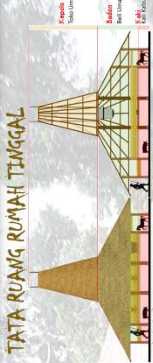
TATA RUANG RUMAH TINGGAL