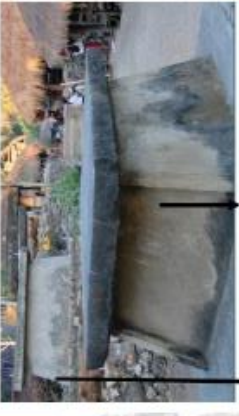
b. BATU MEGALITIK TARIBANG