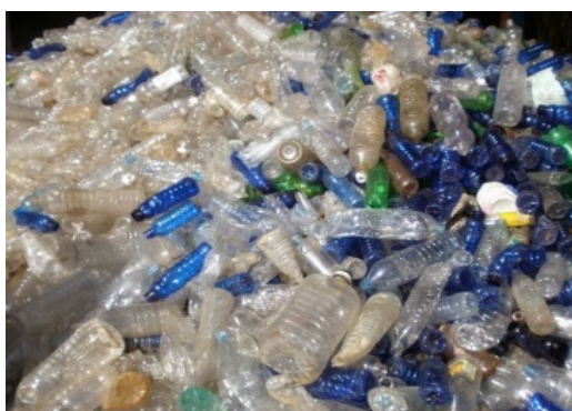
Gambar 1. Tumpukan Sampah di RT 01 RW 17 Srengseng Dawah