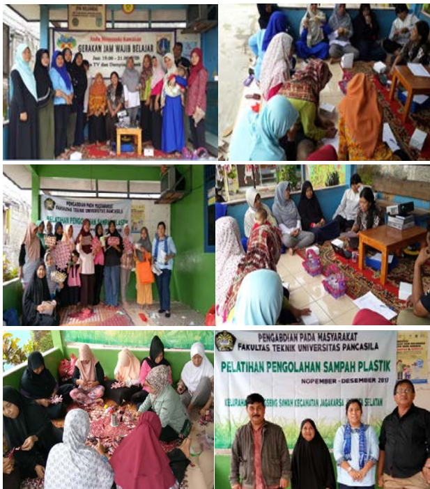
Gambar 4. Foto Kegiatan Pengelolaan Sampah Plastik di Kelurahan Srengseng Sawah