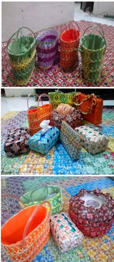
Gambar 5. Hasil Kreasi Sampah Plastik di Kelurahan Srengseng Sawah