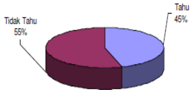
Gambar 2. Prosentase Wawancara Pengertian Sampah