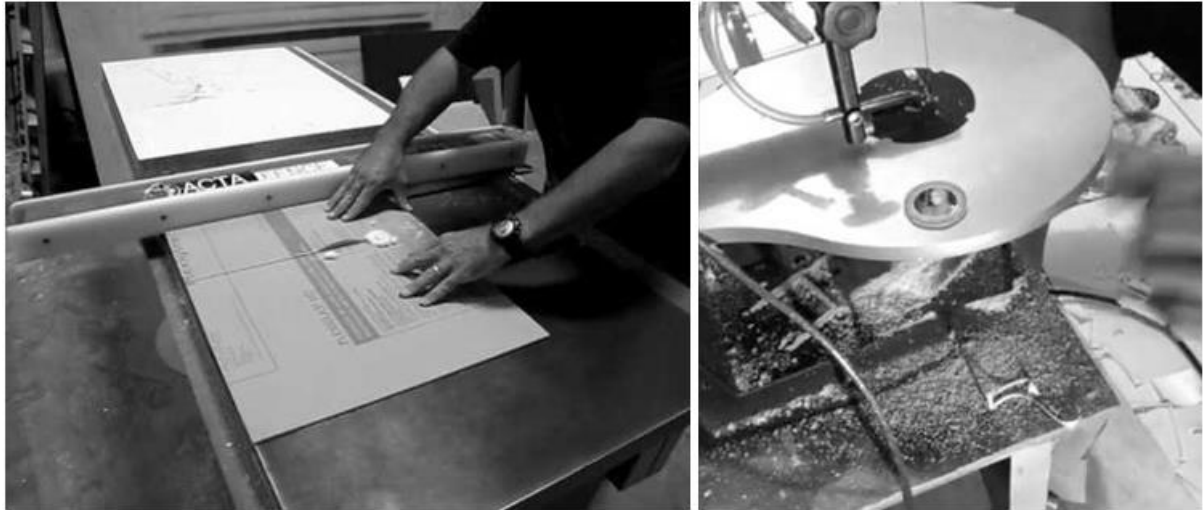
Gambar 2. Proses potong akrilik

c. Hasil jadi merupakan prototype untuk diproduksi massal. Kemasan yang telah jadi dibersihkan dan dijadikan prototype untuk diproduksi massal. Kemasan menghasilkan sisi yang jernih sehingga tautan yang berada ditengah dapat menyangga aksesoris dan menonjolkan letak aksesoris yang seolah melayang.