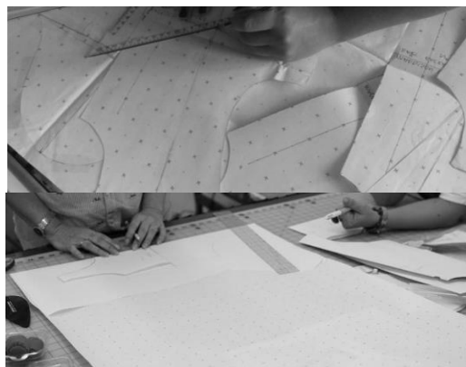
Gambar 10. Studi hasil penggambaran digital Pantalon.

Setelah terpilihnya bahan – bahan, proses pembuatan pola dapat diintegrasikan dengan variasi detail sambungan. Pembuatan pola dasar dilakukan terlebih dulu berdasar atas pengetahuan umum penjahit keliling. Pola dasar ini diperbaiki dengan membuat dasar pantalon berjenis pensil. Dari pola dasar digambar ulang dengan pattern making software menjadi pola digital. Pola digital ini menjadi pola dasar untuk dikombinasikan dengan cara twisting yakni membebaskan, memotong dan menyatukan pola pantalon digital dengan pola lain seperti sarung, rok, apron yang telah ditumpang tindihkan. Pola yang terjadi dicetak untuk diuji coba secara manual agar dapat disempurnakan. Proses twisting diuji coba secara manual, agar penggambaran dua dimensi yang berbentuk lembaran dapat menyatu secara benar saat diterjemahkan menjadi volume.