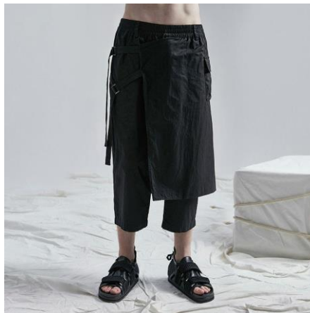
Gambar 3. Deconstructed Pantalon.