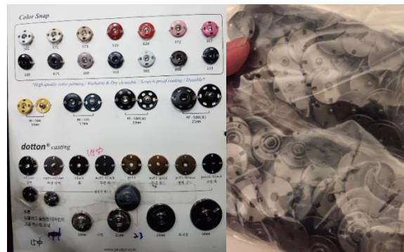
Gambar 9. Variasi dan detail sambungan Pantalon.

Untuk menghasilkan pantalon yang dapat ditransformasikan, pilihan detail dan sistem sambungan sangat menentukan. Maka dari itu, survey bahan tidak saja menjadi penting untuk disesuaikan dengan pilihan detail sambungan. Kepaduan ini perlu direncanakan agar menjadi kesatuan dengan desain prototipe pantalon itu sendiri. Melalui investigasi, terpilihlah detail kancing dan model sambungan yang cocok untuk membuat kompleksitas pantalon yang dapat dikreasikan menjadi tipe – tipe bawahan lain. Dengan terpilihnya detail – detail yang berfungsi untuk menyambung, sebuah rangkaian sambungan akan membantu peluang untuk mentransformasikan dan menambahkan fungsi – fungsi tambahan pada pantalon.