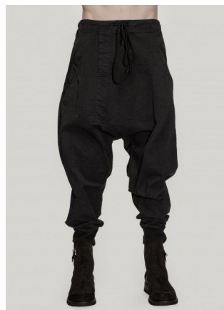
Gambar 1. Kreativitas Manipulasi Pola Struktur Pantalon

Sebuah pelatihan pantalon ditawarkan bagi kelompok penjahit keliling gang Opek dengan berpikir meruang dengan pola, struktur dan volume. Hal ini dilatar belakangi juga atas ketersendatan perkembangan desain pantalon yang sering kali berjalan di tempat. Titik berat dilakukan pada pembuatan pola untuk pantalon dengan menyatukan beberapa tipe bawahan dan menyisipkan fungsi tambahan pada struktur pantalon dasar yang dimiliki penjahit sehingga menghasilkan volume meruang yang baru. Memang benar, pelatihan ini belum sepenuhnya menjamin keberlangsungan profesi penjahit, namun secara umum memberikan pengetahuan design pantalon bagi kelompok penjahit agar tidak sekedar mahir memperbaiki pantalon atau jeans namun juga bekerja menggunakan kreativitas (Grassby, 2005). Pengetahuan akan pola dengan cara berpikir meruang pada pantalon akan dikombinasikan dengan bahan dan teknik yang tidak umum digunakan penjahit keliling agar pengetahuan mereka berkembang (Doğan, 2012), dan bukan tidak mungkin menjadi proses seleksi kepada mereka yang bekerja dengan baik. Dengan demikian, penjahit pantalon gang Opek akan mulai mempelajari cara – cara baru membuat bawahan lain, termasuk memadukannya menjadi pola pantalon kreatif.