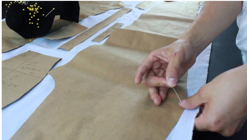
Gambar 5. Proses Pembuatan Pola Pantalon Manual.

Bahan pola merupakan bahan umum dan sederhana namun menjadi standar industri antara lain: kertas roti, belacu, perca. Alat kerja dasar sebagian kecil dimiliki oleh penjahit namun alat kerja spesifik disiapkan agar pelatihan menjadi seragam. Kertas dan karton menjadi media dalam sketsa pola manual, ditunjukkan proses membuat pola dengan pattern making software pada power point presentation untuk memberikan wawasan baru.