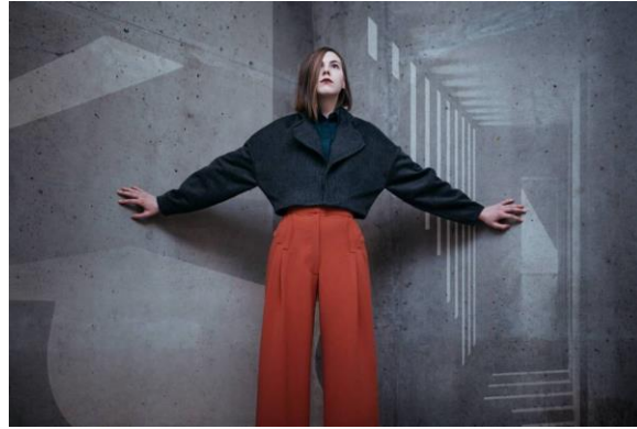
Gambar 2. Architectural Pants.