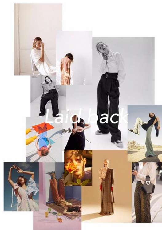
Gambar 6. Presentasi Trend Pantalon.

Melalui investigasi terhadap mitra, pekerjaan penjahit keliling gang Opek terkonsentrasi pada kemampuan reparasi dan jahitan perbaikan pada pantalon. Namun demikian, mereka umumnya menguasai pola pantalon dasar yang berbentuk flat . Mereka pun mengakui kemampuan mereparasi bahan lain seperti kemeja, rok, jeans namun tidak mampu mengerjakan pola rumit. Pekerjaan dilakukan manual, baik dengan mesin klasik jenis butterfly atau singer yang ditambatkan pada meja portable . Maka dari itu sebuah sketsa berupa kumpulan contoh – contoh pantalon yang sedang trend dihimpun untuk memperlihatkan kemungkinan – kemungkinan yang dapat dihasilkan untuk membuat prototipe pantalon.