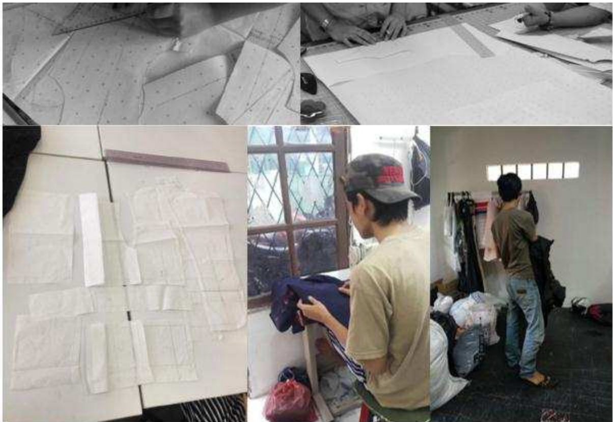
Figure 1. Study of Pantalon cad pattern twisting and twisting pattern drawing results

The method of a twisting pattern is a graded output as the development of basic pantaloons patterns controlled by tailors, assisted with CAD drawing which is commonly used by architects to draw buildings so that producing CAD pattern making is a test tool to facilitate the making of type pantaloons (Figure 1). Simulation and inspiration are arranged to use the PowerPoint presentation.