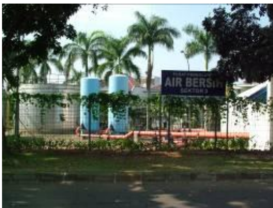
Gambar No 3 Instalasi pengolahan air bersih

Sumber air bersih kota BSDi berasal dari hasil pengolahan air, yang memanfaatkan sungai Cisadane ( sebuah sistem yang mengolah air permukaan ) sebagai sumber air bersih, adanya fasilitas air bersih yang dikelola oleh BSD menghindari eksploitasi air tanah oleh penghuni perumahan maupun perkantoran. Sampai saat ini jumlah pengolahan air bersih ( water treatment plan ) sebanyak 5 buah Lokasi letaknya tersebar di beberapa tempat.