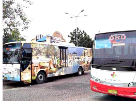
Gambar No 7, stasiun Bus

Kota BSD dilengkapi pula oleh Stasiun Bus bagi kebutuhan penduduknya, yang terletak di tengah kota BSD, di samping itu juga di lingkungan kota BSD, terdapat 2 stasiun kereta api.