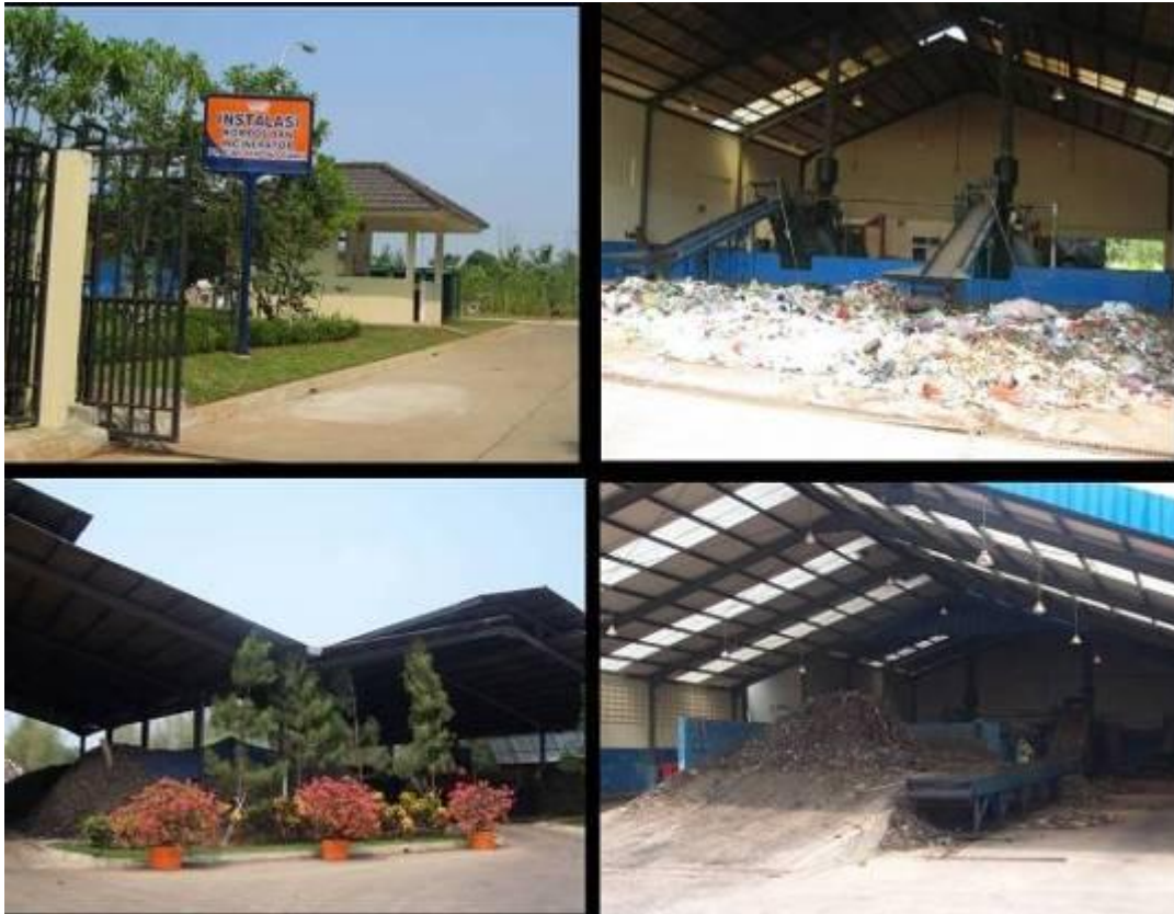
Gambar No 5 Proses pengolahan sampah Sumber Bumi Serpong Damai, 2010

Jaringan utilitas, BSD telah membangun saluran drainase, yang dialirkan ke beberapa pond/situ di samping mengalirkan ke sungai yang mengalir di wilayah kota BS