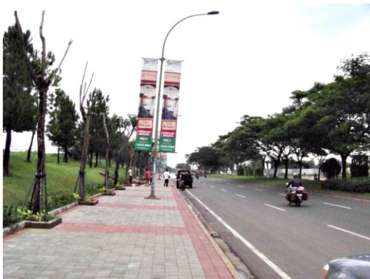
Gambar No 6, salah satu jalan penghubung

Menurut Suripan (2006), vegetasi dengan Kerapatan tanaman adalah hal yang lebih penting dibandingkan jenis tanaman. Kerapatan tanaman akan mempengaruhi panjang lintasan aliran permukaan dan luasan lahan yang tertutup, menyikapi hal ini sebaiknya daerah RTH, hutan kota, jalur hijau jalan, taman perkantoran, badan sungai, situ, dan lahan pembatas antara jalan dengan klaster, dan lahan pada sudut jalan sebaiknya ditanami dengan kerapatan yang maksimal.