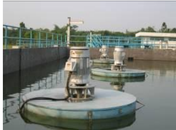
Gambar No 4 Pengolahan Limbah Cair Industri

Pembuangan dan pengolahan limbah, khusus untuk limbah industri BSD memiliki fasilitas pengolahan untuk limbah beracun yang tidak berbahaya. Pengolahan limbah berupa Waste Water Treatment Plan (WWTP) yang bersifat communal ini diperuntukan untuk mengolah limbah non-B3 dari light industry di Kawasan Industri Taman Tekno BSD