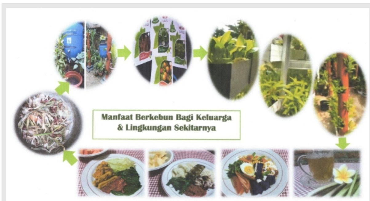
Gambar 5. Manfaat Berkebun Bagi Keluarga

Rekayasa sosial melalui berkebun sudah direalisasikan dalam kegiatan pengabdian masyarakat bersama PKK RT 02/02 Beji Timur Depok. Luaran ini sebagai media untuk