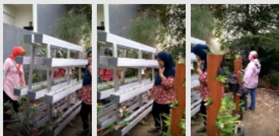
Gambar 2. Merubah Lahan Tidur Menjadi Kebun

menjadi tanggung jawab Kelompok Kerja (Pokja) III dengan program yaitu: (1) Mengembangkan dan memanfaatkan potensi dan sumberdaya keluarga dalam rangka memenuhi kebutuhan keluarga dan diversifikasi pangan lokal. (2) Pemanfaatan sumberdaya alam melalui teknologi tepat guna dengan memanfaatkan lahan pekarangan (PKK, 2016). Dengan demikian aktivitas berkebun relevan dengan semboyan HATINYA PKK yang bertujuan menciptakan "Halaman, Asri, Teratur, Indah dan Nyaman". Luaran kegiatan berupa sudut hijau atau kebun contoh diharapkan dapat membantu kader dalam merealisasikan misi di atas.