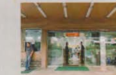
📍 🌟 🕒