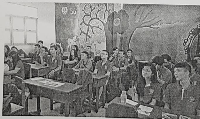
Presentasi di kelas