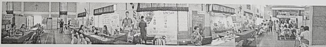
Stand Untar dibagian Depan Pameran