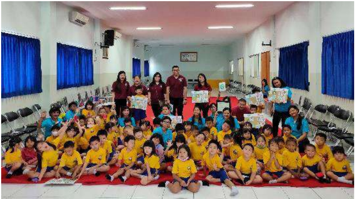
Gambar 17. Foto bersama