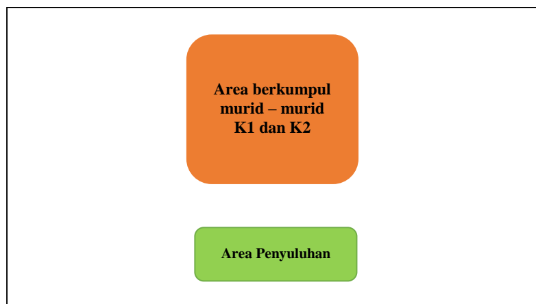
Gambar 2. Skema pelaksanaan bakti kesehatan

Peserta penyuluhan dibawa oleh gurunya dari masing-masing kelas untuk berkumpul di aula sekolah lantai 3. Setelah semua murid terkumpul, maka acara dimulai dengan Pembukaan oleh Kepala Sekolah, pembacaan doa oleh Guru Agama, penyuluhan dan dilanjutkan dengan permainan games.