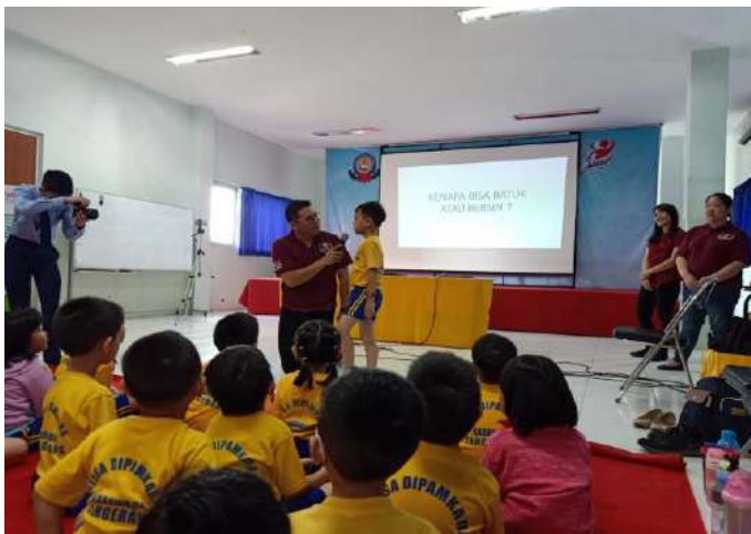
Gambar 8. Murid K2 sedang menjawab pertanyaan dari penyuluh