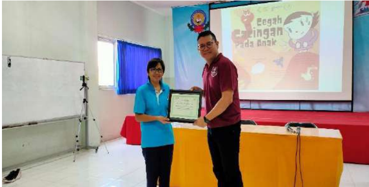
Gambar 14. Penyerahan sertifikat ucapan terima kasih

Kegiatan kemudian dilanjutkan untuk kegiatan bakti kesehatan lain, yaitu mengenai pencegahan penyakit infeksi caceng. Acara kemudian dilanjutkan dengan Pemberian Sertifikat ucapan terima kasih kepada KB dan TK Atisa Dipamkara yang diwakilkan oleh Kepala Sekolah, Kemudian dilanjutkan foto bersama. Pembagian souvenir diberikan dikelas masing-masing, mengingat berakhirnya acara bertepatan dengan jam makan murid-murid.