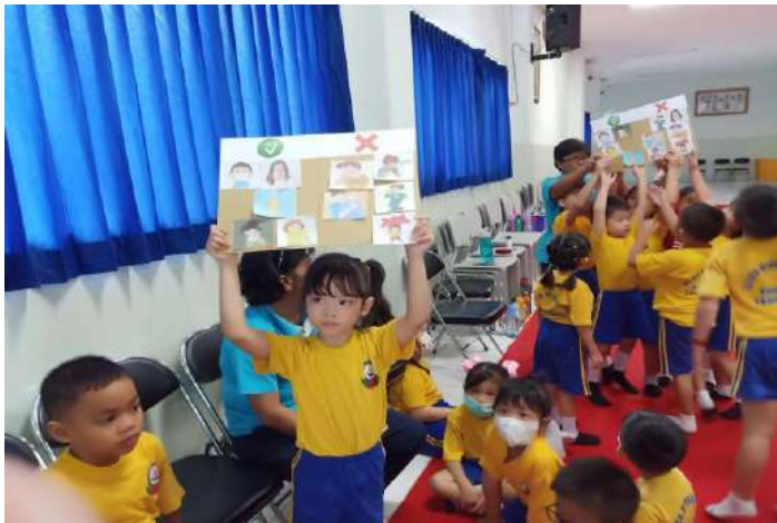
Gambar 11. Murid K1 dan K2 sedang main games