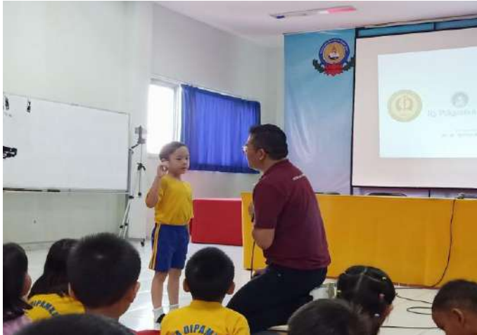
Gambar 7. Murid K1 sedang menjawab pertanyaan dari penyuluh