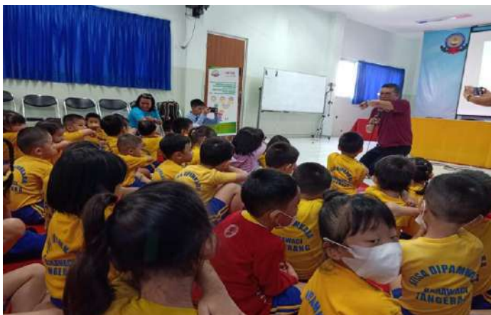
Gambar 9. Penyuluh sedang memperagakan etika batuk yang benar