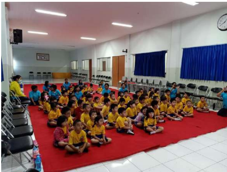
Gambar 4. Murid-murid K1 dan K2 sedang duduk menunggu acara dimulai