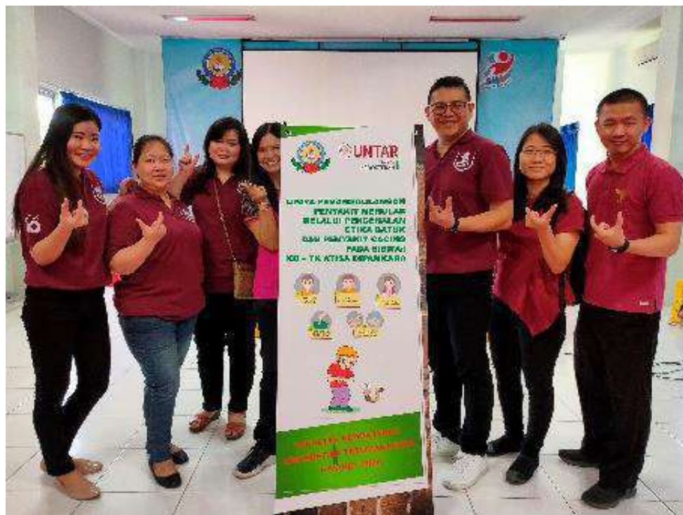
Gambar 18. Foto tim PKM