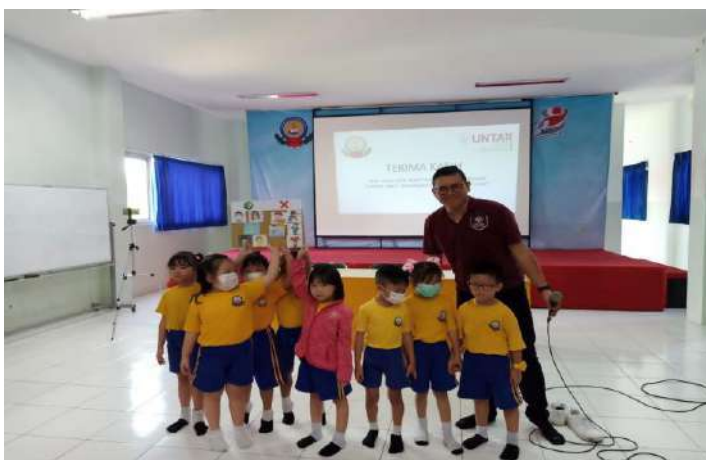
Gambar 13. Salah satu kelompok yang kurang tepat dalam penempelan gambarnya