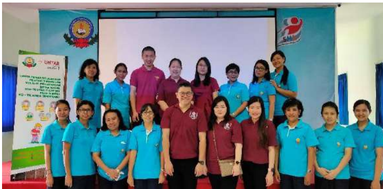
Gambar 15. Foto bersama tim PKM dengan guru