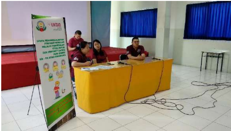
Gambar 3. Tim sedang menunggu kehadiran murid-murid K1 dan K2

Indonesia (PDPI), Rumah Sakit Persahabatan dan Indonesia Initiative on MDR TB Care (IMTC) yang di unduh dari youtube.