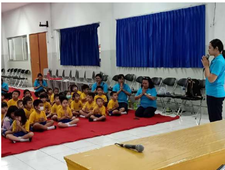
Gambar 5. Pembacaan doa oleh guru agama