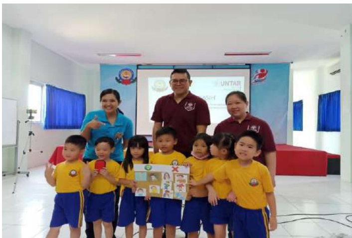
Gambar 12. Salah satu kelompok yang menempelkan gambar dengan benar