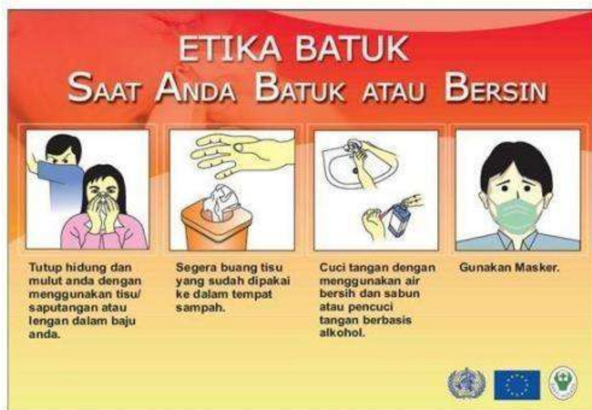
Gambar 1. Etika Batuk

Sumber gambar : Permenkes RI No. 27 /2017 tentang Pedoman Pencegahan dan Pengendalian Infeksi di Fasyankes