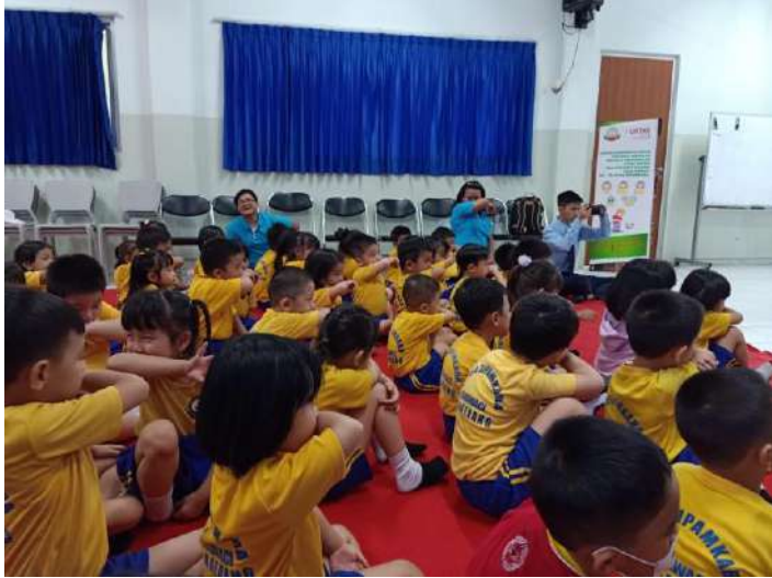
Gambar 10. Murid K1 dan K2 mengikuti cara etika batuk yang benar

Setelah kegiatan penyuluhan selesai, murid – murid K1 dan K2 diajak untuk bermain games. Games berupa mencari foto etika batuk yang benar. Murid-murid K1 dan K2 dibagi menjadi 8 kelompok ( K1 4 kelompok dan K2 4 kelompok). Masing-masing kelompok terdiri dari 8 orang murid dan dibantu oleh 1 orang guru. Tiap kelompok diberikan 10 buah gambar mengenai etika batuk dan 1 buah papan yang terbagi 2 kolom (kolom benar dan salah). Anak-anaki diminta untuk menempelkan foto yang telah diberikan ke masing-masing kolom. Dari 10 gambar tersebut ada 4 buah gambar merupakan cara etika batuk yang benar dan 6 gambar adalah cara etika batuk yang salah. Anak-anak diminta untuk mengerjakan sendiri, sedangkan guru hanya mengawasi saja.