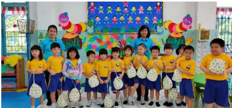
Gambar 16. Pembagian souvenir