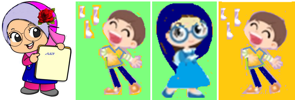
Gambar 3 : Komponen poster infografis terdapat kartun siswa untuk menarik pembaca, Dan menggambarkan obyek yang dituju.