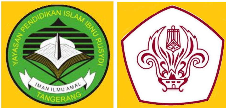
Gambar 1 : Komponen poster infografis terdapat Logo institusi pendukung

Konten dalam poster dan ex-banner infografis tersusun dari materi kecerdasan majemuk/ multiple intellige ce, profesi yang mendukung di setiap potensi kecerdasan, dan ajakan kepada semua pihak untuk memahami kecerdasan majemuk pada anak. Poster dan ex-banner infografis disajikan dengan warna yang cerah untuk menarik perhatian dan memberi efek semangat, kata dipilih dengan ukuran yang besar dan jelas, logo institusi penyelenggara, penjelasan sekilas tentang jenis-jenis kecerdasan, serta kartun siswa yang menarik menggambarkan obyek yang dituju. Komponen desain poster dapat dilihat pada Gambar 1, 2, 3, 4. Gambar 5 merupakan hasil desain poster dan ex-banner yang telah terkonsep dan siap produksi.