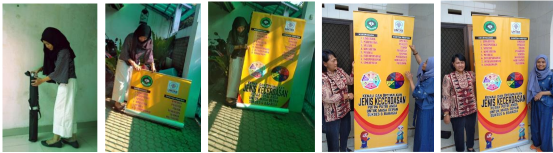
Gambar 7 : Hasil Desain Infografi Berupa Ex-Banner Diimplementasikan di Area Tunggu Sekolah dan Depan Ruang Guru

Infografis diimplementasikan pada area guru dan area tunggu dengan hasil analisis sbb :