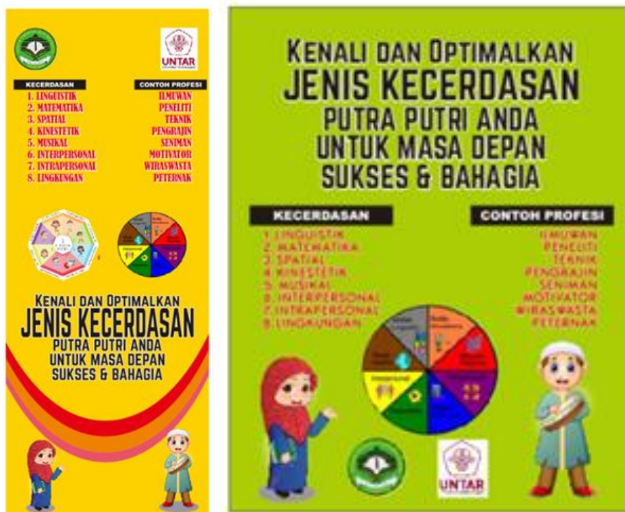
Gambar 5 : Desain poster infografis berupa ex-banner dan poster tentang kecerdasan majemuk/ multiple intelligence