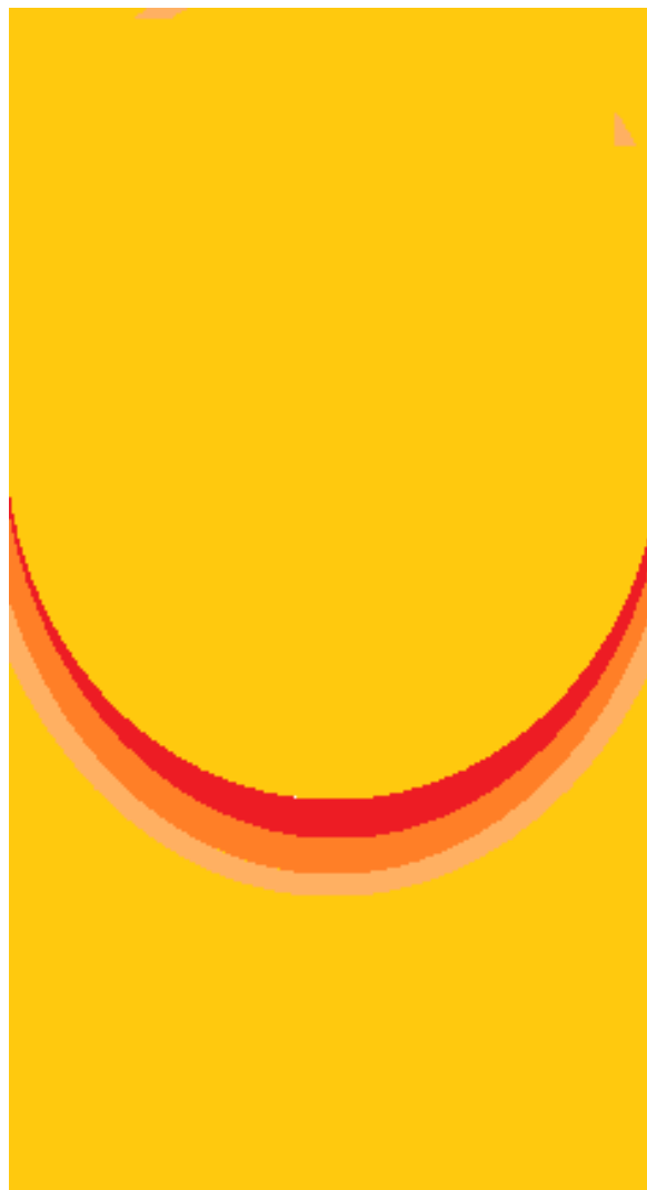
Gambar 4 : Komponen background poster infografis warna yang cerah untuk menarik pembaca dan memberi efek semangat