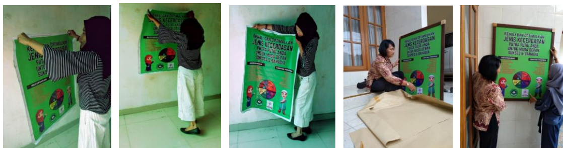
Gambar 6 : Hasil Desain Infografi Berupa Poster Diimplementasikan di Area Tunggu Sekolah

Implementasi poster dan ex-banner dapat dilihat pada Gambar 6 dan Gambar 7.