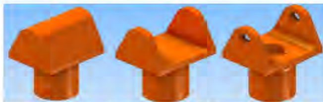
Gambar 2. Pembuatan part modeling produk 13