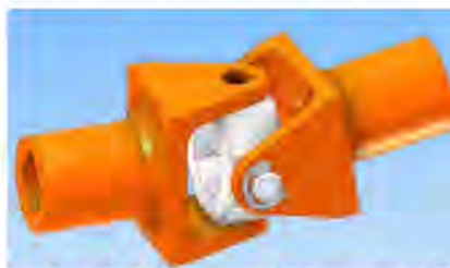
Gambar 1. Salah satu contoh Desain Produk Mekanikal

Melihat permasalahan tersebut maka kami perlu menindak-lanjutnya dengan memberikan pendampingan ToT kepada para guru dan siswa SMA/SMK secara berkelanjutan, dalam hal penguasaan perangkat lunak untuk desain produk mekanikal. Pendampingan akan dilaksanakan kepada para peserta untuk memperoleh uji kompetensi dengan sertifikasi secara internasional bagi para peserta yang sudah dianggap mampu dan berkompeten. Dengan memperoleh sertifikasi secara internasional maka peserta pendampingan kegiatan ini telah dianggap berkompeten dan professional di bidang desain produk mekanikal tersebut.