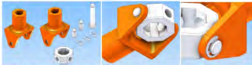
Gambar 5. Assembly /perakitan suatu produk mekanikal

Peserta kegiatan PKM ini adalah guru dan siswa/i SMA dan SMK dari daerah JABODETABEK. Jumlah peserta dari SMA 1 Barunawati sebanyak 6 peserta, SMK 1 Barunawati sebanyak 7 21 erta, SMA Santa Laurensia sebanyak 22 peserta, dan SMAN 101 sebanyak 2 peserta untuk kegiatan selama 2 (dua) hari pelatihan dan 1 (satu) hari ujian sertifikasi. Hasil luaran lain dalam kegiatan ini adalah sertifikat keikutsertaan sebagai peserta dalam pelatihan ini, sebagai wujud penguasaan minimal pengetahuan tentang desain produk mekanikal dengan menggunakan software.