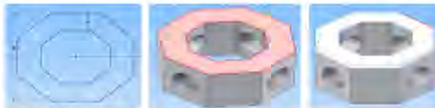
Gambar 3. Pembuatan part modeling produk 2