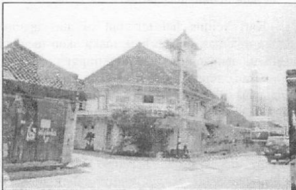
Langgar Merdeka didirikan Tahun 7 Juli 1877 (dokumen pribadi-1999)