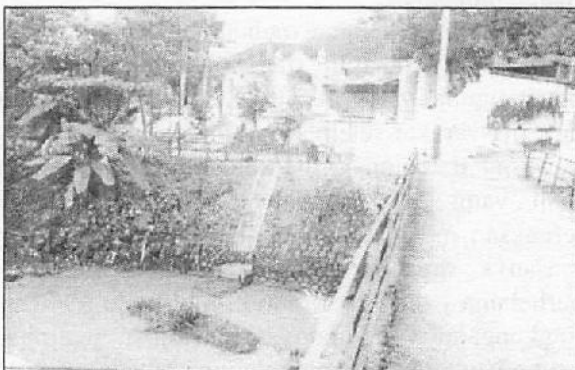
Mesjid Laweyan (dokumen pribadi -1999)