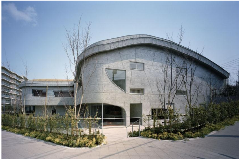
gambar Perspektif bangunan

Arsitek: Chiaki Arai Urban and Architecture Design