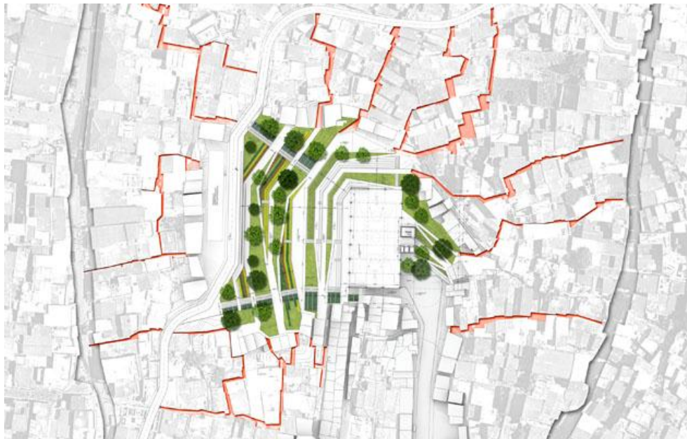
gambar Block Plan Bangunan

Bangunan ini akan mewadahi berbagai kegiatan aktifitas seperti sekolah music, dimana program lain ditumpuk seperti gym, gallery, teater, dan berbagai aktifitas lain yang mampu mengangkat potensi kawasan. Ruang hijau bertujuan menjadi oase di area lingkungan yang "gersang", serta area terbuka diperuntukan bagi aktifitas – aktifitas sosial yang menjadi dasar kebutuhan manusia, dan mencegah konflik yang sering terjadi akibat ketegangan yang muncul karena pendidikan yang serta aktifitas interaksi sosial yang rendah sehingga tercipta santimen sosial.