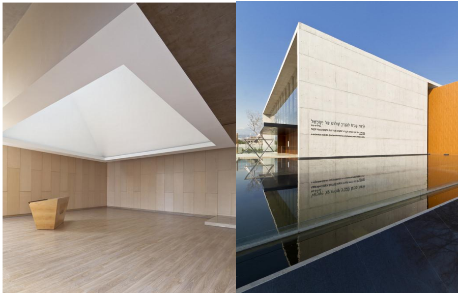
gambar Eksterior dan Interior bangunan