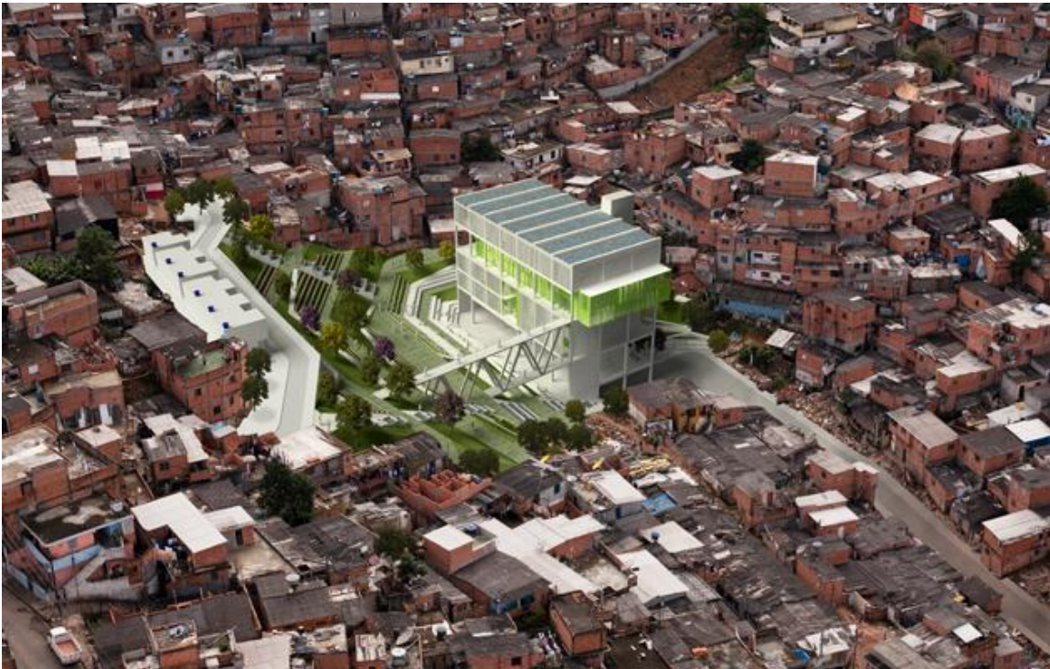
gambar Bird view bangunan