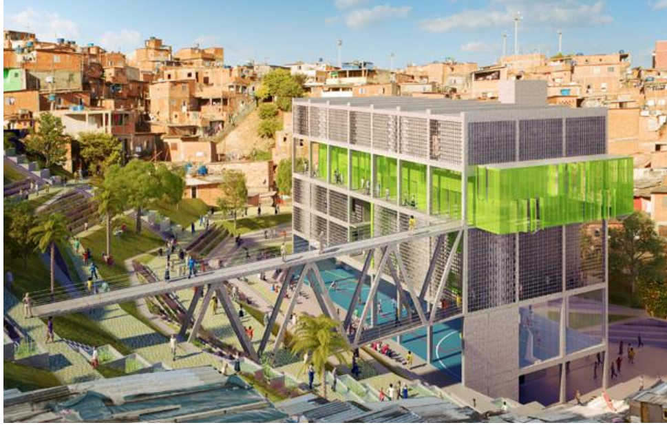
gambar Perspektif Bangunan