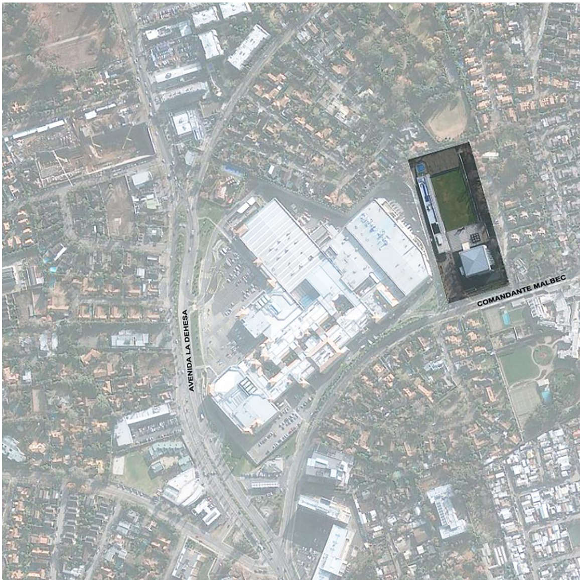
gambar Siteplan Bangunan