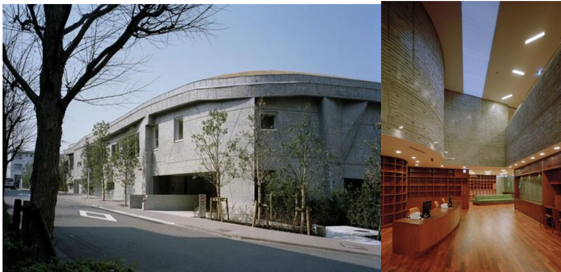
gambar Eksterior dan Interior bangunan