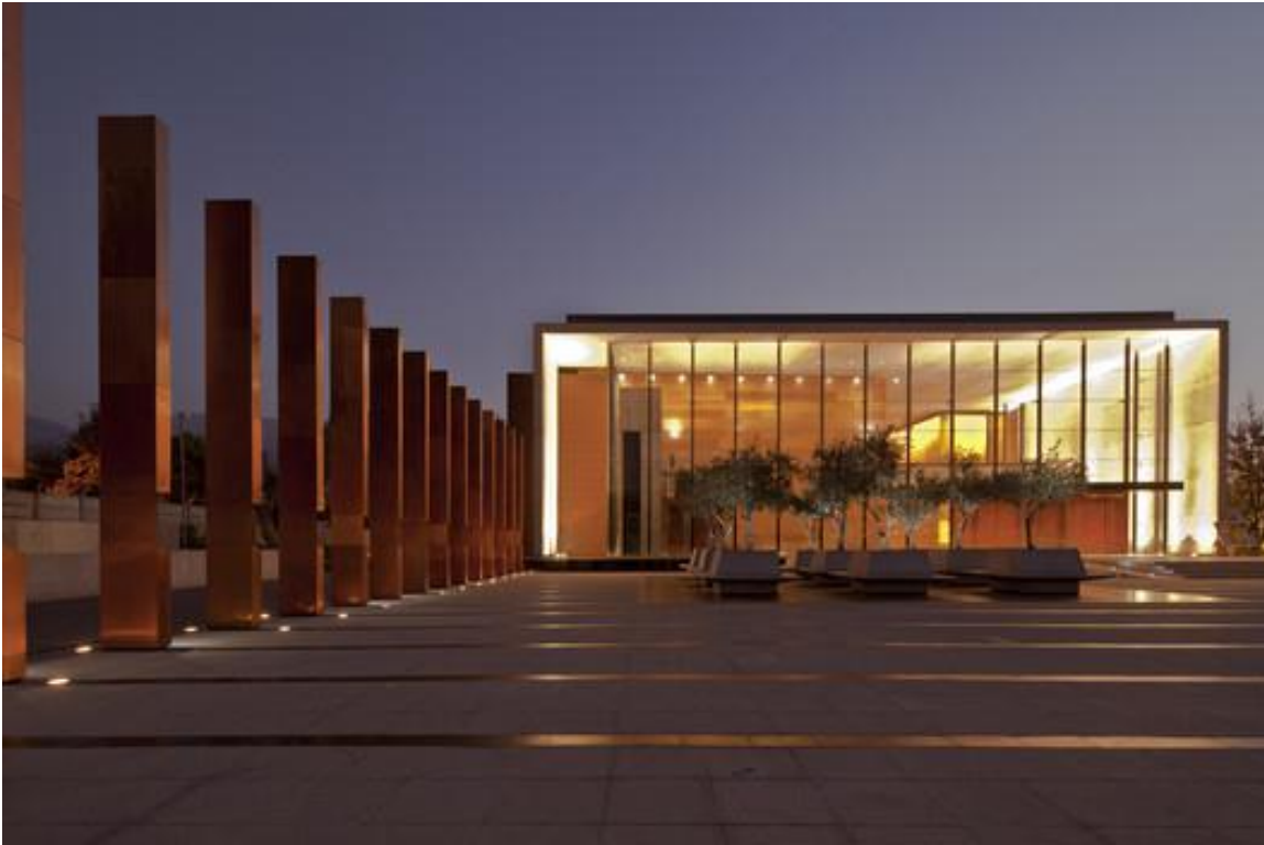
gambar Eksterior bangunan

Arsitek: JBA , Gabriel Bendersky , Richard von Moltke