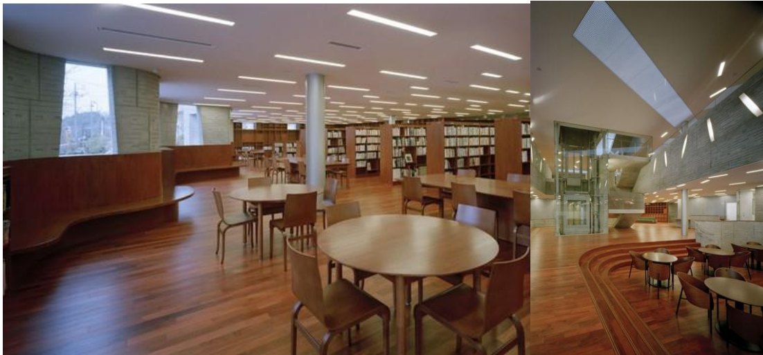
gambar Interior bangunan Community hall, dan perpustakaan

yang digunakan pada desain bangunan juga merupakan material yang menjadi bagian sejarah kawasan tersebut, sehingga unsur historis serta keakraban dengan bangunan sekitar dapat dicapai.