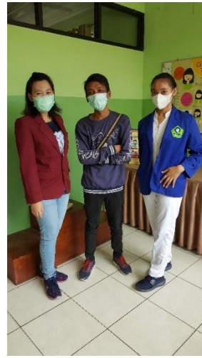
Beberapa dokumentasi bersama pasien TB MDR