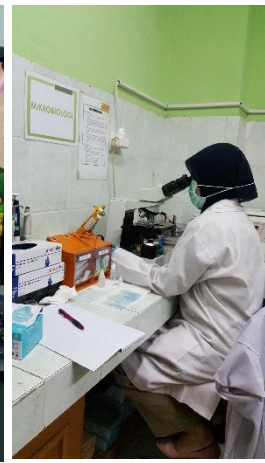
GeneXpert – tradisional (Ziell-Neissen)

Alat yang digunakan untuk mendiagnosis TB MDR dan TB paru