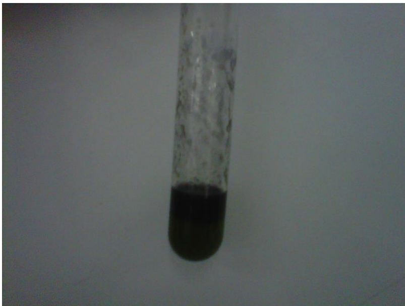
Gambar Hasil Pengujian Golongan Fenolik pada Sampel Kering Terbentuk Warna Ungu