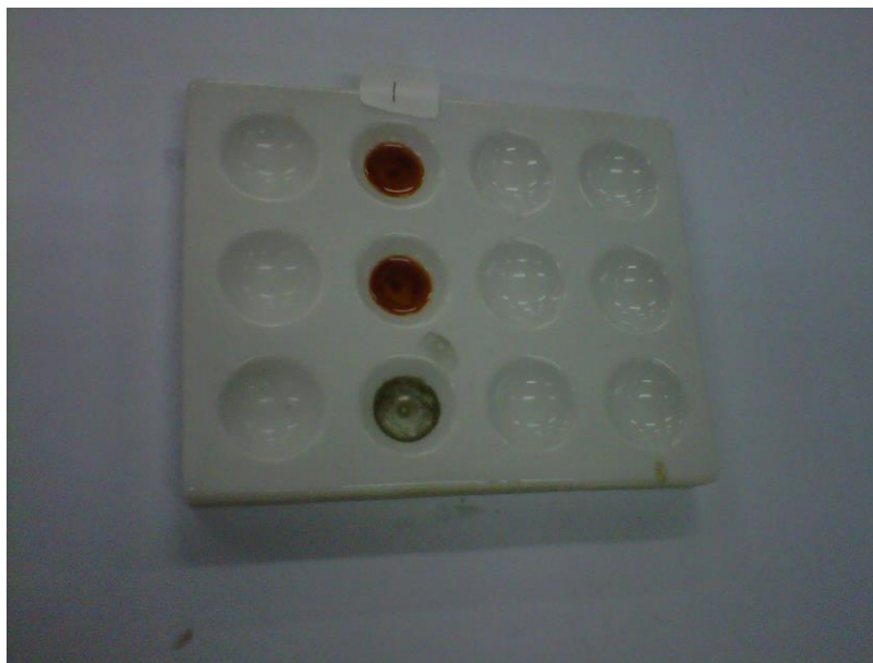
Gambar Hasil Pengujian Golongan Steroid pada Sampel Kering Terbentuk Sedikit Warna Ungu dan Terpenoid Terbentuk Sedikit Warna Merah