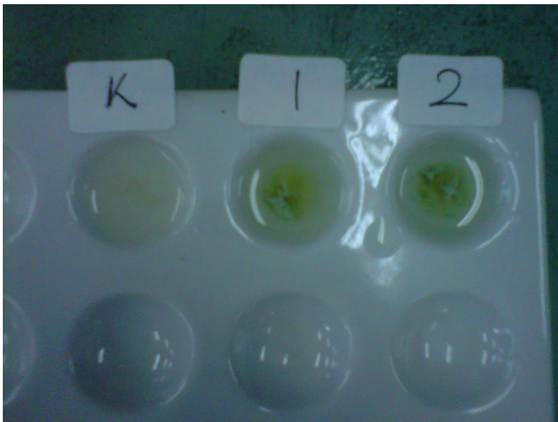
Gambar Hasil Pengujian pada Sampel Segar Golongan Steroid Terbentuk Warna Kebiruan dan Terpenoid Terbentuk Warna Keunguan