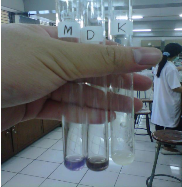
Gambar Hasil Pengujian Golongan Alkaloid pada Sampel Segar Terbentuk Sedikit Endapan Putih pada Pereaksi Meyer dan Endapan Jingga pada Pereaksi Dragendorf