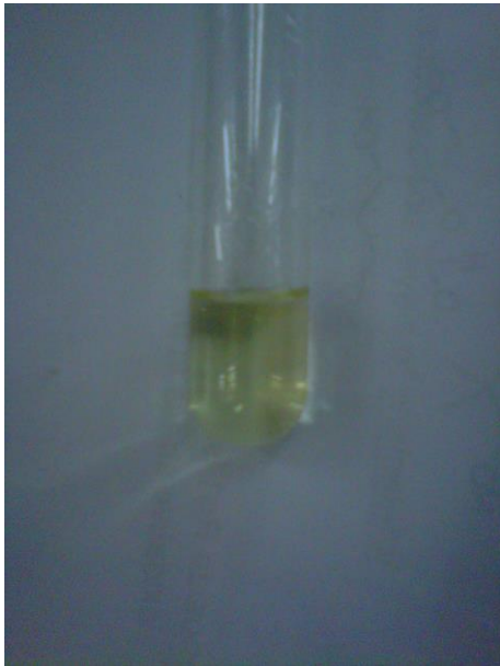
Gambar Hasil Pengujian Golongan Flavonoid pada Sampel Segar Tidak Terbentuk Warna Kuning