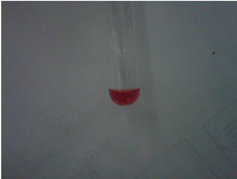
Gambar Hasil Pengujian Golongan Flavonoid pada Sampel Kering Terbentuk Warna Kuning