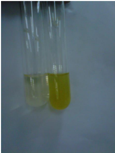
Gambar Hasil Pengujian Golongan Fenolik pada Sampel Segar Tidak Terbentuk Warna Ungu