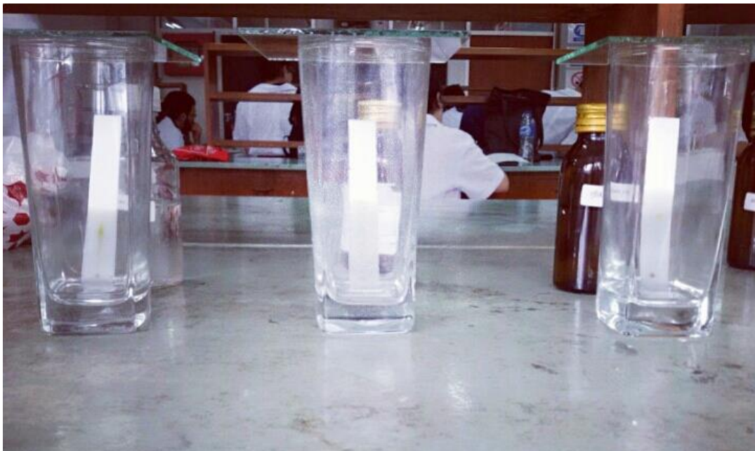
Dielusi dengan Eluen