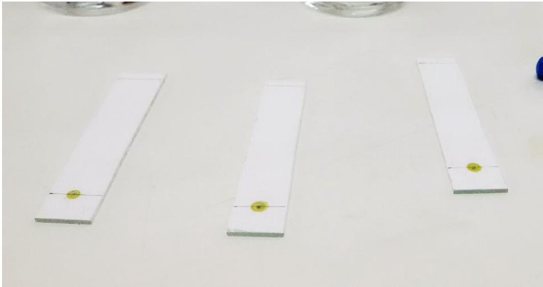
Penotolan Ekstrak Daun Puring pada Plat