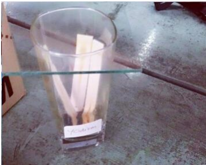
Spot pada Plat Diperiksa dalam Chamber yang Berisi Iodium