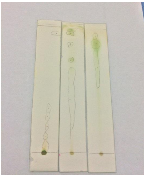
Hasil KLT Eluen Murni