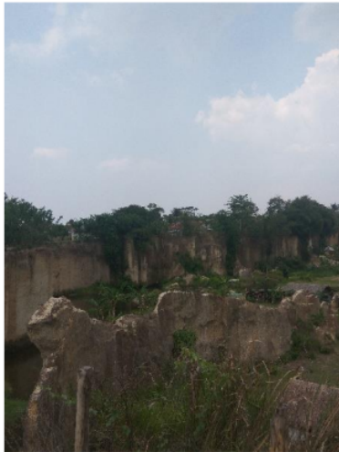
Gambar 3. Tebing berbentuk Kepala Godzilla

Masyarakat di sekitaran Tebing Koja atau masyarakat Desa Cikuya merupakan masyarakat yang dari dahulunya lahir dan tinggal di tempat tersebut, pencaharian mereka adalah sebagai besar petani. Namun, tradisi oleh manusia dapat di ubah, tradisi dapat dikombinasikan dengan semua aktivitas manusia yang beragam (Koencaningrat dalam Rahardjo, 2019:31). Karena dalam pengembangan pariwisata tentunya tidak dapat dipisahkan dengan partisipasi. Menurut Rahardjo (dalam Riskayana, 2012:182) partisipasi berupa keikutsertaan masyarakat dalam program pembangunan. Karena pada dasarnya partisipasi dapat dibedakan menjadi dua, partisipasi dengan keikutsertaan dan berperan serta atas dasar kesadaran sendiri dan kemauan sendiri tanpa adanya dorongan, dan partisipasi dengan keikutsertaan dan berperan serta atas dasar pengaruh dari orang lain atau adanya ajakan dari seseorang.