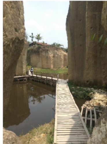
Gambar 4. Jembatan Kayu di Tebing Koja

Pada pengembangannya, masyarakat di sekitaran Tebing Koja cukup aktif terlibat dalam proses kegiatannya, antara lain sebagai karyawan pengelola Tebing Koja yang membantu untuk menjaga dan memelihara lingkungan wisata Tebing Koja, mereka juga melakukan pemeliharaan pada sarana dan prasarana kemudian tempat spot foto jika mengalami kerusakan mereka perbaiki, partisipasi lainnya yang dilakukan masyarakat Tebing Koja adalah menjadi penjaga parkir pada objek wisata, kemudian adanya juga yang sebagai pemandu atau pendamping wisatawan yang akan diajak berkeliling menelusuri semua area Tebing Koja dan mereka juga menerima jasa untuk mengambilkan foto pengunjung di tempat yang memiliki angle bagus. Hal