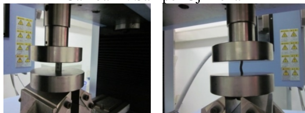
Gambar 2. Proses Uji Tekan