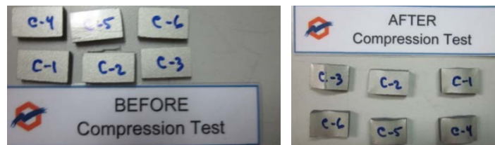
Gambar 1. Sampel Uji Tekan

Mesin : Universal Testing AGS-G Test speed : 1,3 mm/min Kondisi ruang : 23 0 C, 52% RH Standard : ASTM 695 Pretension : 0,5 MPa