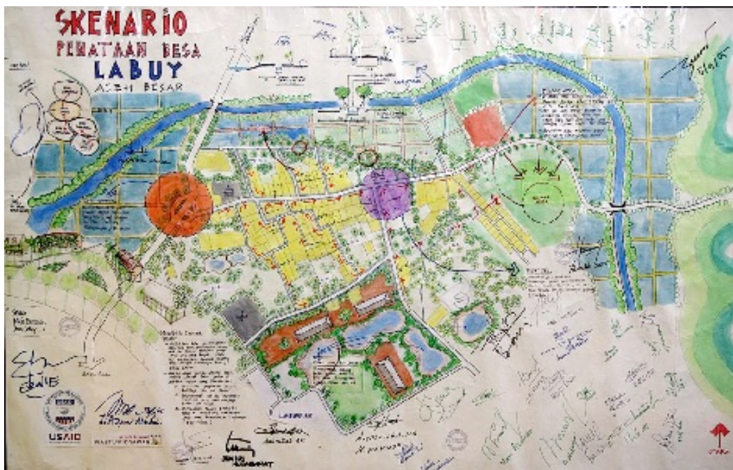
Gambar 3. Contoh Peta Rencana Desa yang Disahkan