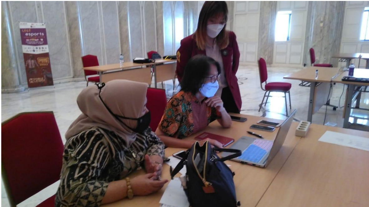
Gambar 3. Tim sedang melayani wajib pajak