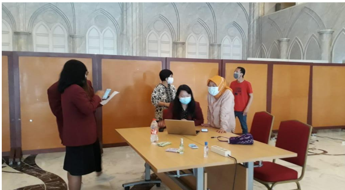
Gambar 2. Tim sedang melayani wajib pajak