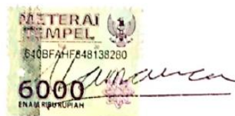
Audi Akbar Namara