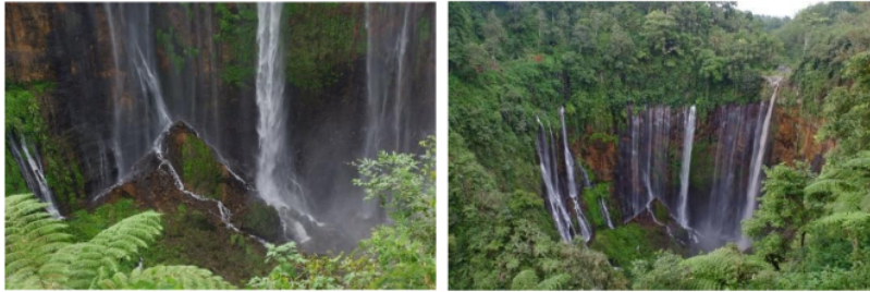
Gambar 1. Panorama Air Terjun Tumpak Sewu