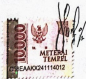
Merry Yasinta C