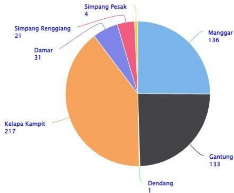
Gambar 1.2 Persebaran UMKM Sektor Perdagangan di Belitung Timur

Dari beberapa informasi di atas, menunjukkan bahwa memang Belitung Timur merupakan salah satu objek lokasi yang sangat penting untuk diteliti. Oleh karena itu, penelitian ini akan meneliti UMKM di Belitung Timur. Selanjutnya, sektor yang akan diteliti adalah sektor perdagangan. Alasan dari sektor perdagangan yang diteliti adalah karena jumlah UMKM di sektor perdagangan yang sangat tinggi mencapai 543 usaha yang dibagi sebagai berikut: