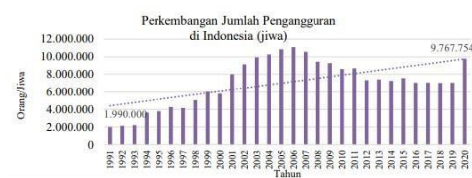
Gambar 1.1 Data Perkembangan Pengangguran di Indonesia

Hal tersebut terbukti berdasarkan data yang didapat dari BPS tahun 2021 di Indonesia sendiri jumlah pengangguran pada tahun 2021 mencapai 9.767.754 di mana data tersebut meningkat sangat tinggi dari tahun-tahun sebelumnya. Kenaikan tersebut disebabkan karena adanya perlambatan ekonomi hingga terjadi pemutusan hubungan kerja (PHK) (BPS, 2021).