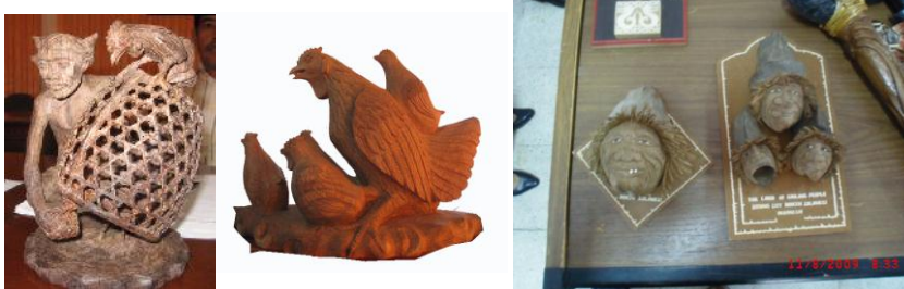
Gambar 9. Para perajin di Bali membuat byang masih dapat dijumpai hingga kini (Samodro, 2009)

Industri kerajinan merupakan industri kreatif karena usaha yang dikembangkan unsur utamanya adalah kreativitas. Kreativitas dapat berkembang baik karena didukung