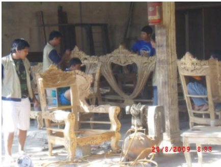
Gambar 2. Para perajin di Bali membuat benda-benda kerajinan dimaksudkan untuk melanjutkan tradisi kegiatan keagamaan yang masih dapat dijumpai hingga kini (Samodro, 2009)

merupakan sentra industri yang telah terbentuk sejak beberapa abad yang lalu. Jepara yang letaknya di pantai Utara Jawa ini telah dikenal luas hingga ke negeri China pada zaman dinasti T'ang pada tahun 674 Masehi itu. 4 Proses pertumbuhan dan perkembangan mebel ukir Jepara dipengaruhi tokoh-tokoh wanita yang telah banyak berperan pada masa tersebut. Dimulai sejak kerajaan Kaling (Ho-Ling) yang diperintah oleh ratu Shima. 5 Ketrampilan para perajin tidak terlepas dari peran penguasa kerajaan pada saat itu guna mendukung kebutuhan kerajaan. Sejak abad 7, Ketrampilan mengukir telah diwariskan secara turun temurun hingga dilanjutkan pada masa Islam di Jawa. Ratu Kalinyamat merupakan tokoh yang berperan pada pengembangan seni ukir di Jepara pada abad ke 16. Proses tersebut selanjutnya dilanjutkan perannya oleh R.A. Kartini hingga ibu Tien Soeharto.