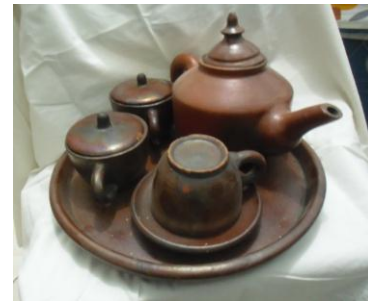
Gambar 3. Produk gerabah dari Bayat, Klaten, Jawa Tengah dibuat dengan kearifan lokal pada bahan baku dan pewarnaan yang dibuat dan dilakukan dengan unsur bahan dari alam. (foto : Samodro, 2011)

Di beberapa sentra industri kerajinan mebel kayu jati juga digunakan beberapa ramuan dedaunan seperti daun tembakau, pelepah pisang dan lain-lain untuk memberi warna dan mengawetkan kayu jati. Upaya kreatif juga dilakukan dalam pengembangan gagasan dalam menentukan tema produk kerajinan.