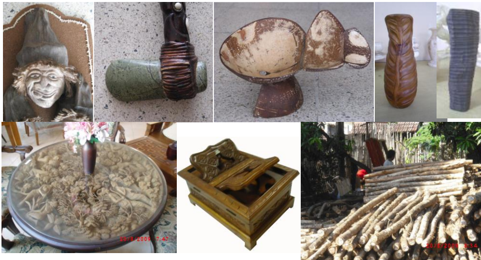
Gambar 6. Bahan baku yang melimpah dan berkualitas merupakan modal dalam pengembangan industri kerajinan berbasis kearifan lokal seperti di Manado dan Bojonegoro (Samodro, 2009)

Ketersediaan bahan baku (sumber daya alam) yang melimpah merupakan anugrah yang dapat dikembangkan oleh masyarakat lokal dengan sentuhan talenta perajin yang