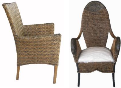
Gambar 7. Cirebon merupakan daerah dengan sentra industri mebel rotan yang sangat banyak namun bahan baku rotan didatangkan dari luar Cirebon.

Letak geografis merupakan faktor pendukung yang sangat penting. Beberapa tempat