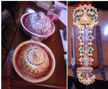
Gambar 1. Para perajin di Bali membuat benda-benda kerajinan dimaksudkan untuk melanjutkan tradisi kegiatan keagamaan yang masih dapat dijumpai hingga kini (Samodro, 2009)

Pada awal sebelum industrialisasi di Indonesia, tumbuhnya perajin-perajin di Nusantara didasari oleh semangat budaya untuk menunjukkan eksistensi budaya mereka. Para perajin Nusantara telah dinyatakan mampu membuat barang-barang seni dan kerajinan yang baik pada awal tarikh Masehi. 2 Para perajin membuat benda-benda