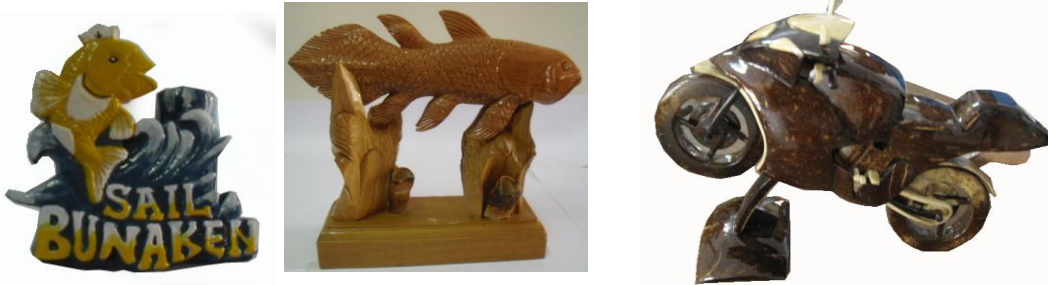
Gambar 8. Seni kerajinan untuk wisata (Samodro, 2009)

Industri kerajinan dapat berkembang dengan baik bila proses produksinya dapat memiliki akses yang baik dengan pasar. Di beberapa daerah yang menjadi objek kajian, pasar kerajinan dapat berkembang karena didukung oleh kegiatan pariwisata. Bali dan Manado