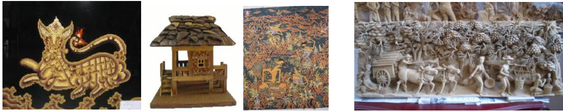
Gambar 5. Produk kerajinan merupakan ekspresi budaya masyarakat yang mencakup agama, ilmu pengetahuan, ekonomi, teknologi, organisasi sosial, bahasa dan komunikasi, serta kesenian. (Samodro, 2009)

kebiasaan membuat barang-barang kerajinan telah dilakukan berabad-abad yang lalu. Penguasa terdahulu dalam kerajaan dapat saja mempengaruhi ketrampilan para perajin.