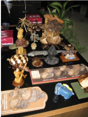
Gambar 4. Produk kerajinan dari Manado sebagai seni kerajinan untuk pariwisata