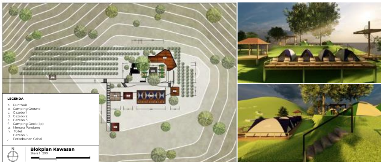
Gambar 5. Rancangan desain camping ground di Puncak Pos Mati Desa Giritengah

Dari sekian destinasi yang ada, saat ini sedang direncanakan penataan destinasi wisata, yang difokuskan pada Puncak Bukit Pos Mati. Dalam proses pengembangannya menjadi salah satu destinasi wisata alam di Desa Giritengah, Puncak Bukit Pos Mati saat ini masih dalam proses melengkapi berbagai fasilitas dasar yang diperlukan pengunjung seperti air, listrik, sanitasi, petunjuk jalan, penerangan, dan program penunjang lainnya. Tim peneliti berusaha menggali kebutuhannya, dan dengan observasi dan pengukuran di lapangan, dibuatlah 3 alternatif rancangan pengembangan. Gambar 5 berikut menunjukkan salah satu alternatif desain yang paling diminati.