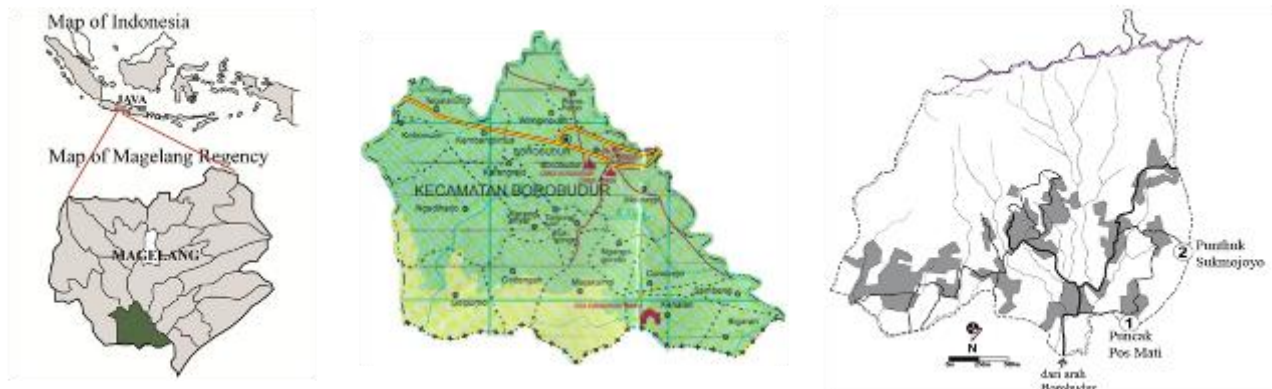
Gambar 1. Lokasi Desa Giritengah

Desa Giritengah merupakan salah satu dari 20 desa di Kecamatan Borobudur, Kabupaten Magelang, Jawa Tengah. Desa ini terletak sekitar 5 km ke arah barat daya dari Candi Borobudur. Luasan Desa Giritengah mencakup sekitar 432.245 hektar. Terdapat banyak potensi wisata, antara lain: Punthuk/puncak bukit dengan pemandangan indah (Punthuk Mongkrong, Puncak Pos Mati, Punthuk Sukmojoyo, Puncak Suroloyo, Gupakan Watu Kendil), sentra peternakan lebah madu, situs bersejarah Sendang Suruh, kerajinan topeng kayu, Padepokan seni budaya, dll. Masyarakatnya masih memegang teguh tradisi dan kearifan lokal, namun mulai ada pengaruh dari luar, antara lain karena pengaruh pariwisata global (Fatimah, et al., 2021).