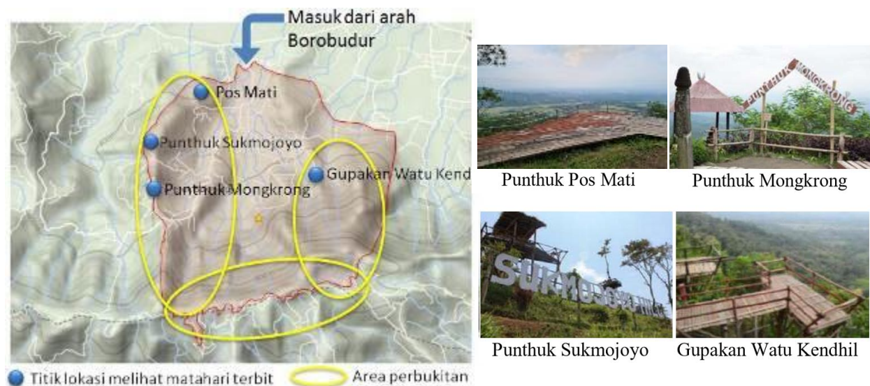
Gambar 2. Kondisi lahan desa yang berkontur dan punthuk yang diolah jadi destinasi wisata