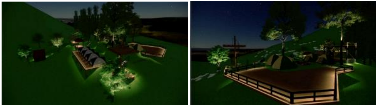
Gambar 6. Visualisasi desain pencahayaan di Puncak Pos Mati

karena lahannya sempit, ditambahkan dek kayu untuk mendirikan tenda. Di ujung timur dibangun menara pandang untuk melihat panorama sekitar dengan lebih leluasa. Lahan puncak bukit bisa juga dimanfaatkan (opsional) untuk camping ground tambahan saat diperlukan. Fasilitas WC memanfaatkan yang saat ini sudah ada, hanya tinggal menambahkan fasilitas untuk penyediaan airnya. Selain itu, direncanakan juga untuk desain pencahayaan pada malam hari. Konsep pencahayaan memadukan antara direct lighting dan indirect lighting , antara lain: aksesibilitas jalan setapak menggunakan bollard sebagai ndirect lighting , Pada tangga yang menghubungkan antara plaza dengan jalan setapak, penerangan indirect lighting menggunakan steplight , Railing deck dapat diletakkan led strip untuk memberikan ambience dan sebagai pengaman penanda batas dek, Uplight pohon diletakkan 1/3 dari tinggi batang pohon dengan sabuk sebagai pengikat lampu ke batang pohon. Konsep pencahayaan tidak hanya difungsikan untuk menerangi suatu tempat, namun juga difungsikan sebagai elemen estetis /dekorasi (Hendrastuti, 2016). Gambar 6 berikut ini merupakan visualisasi dari simulasi pencahayaan yang dilakukan oleh tim peneliti. Dengan adanya sistem pencahayaan, destinasi wisata Puncak Bukit Pos Mati bisa dikunjungi baik pada siang maupun malam hari.