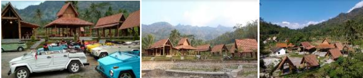
Gambar 4. Fasilitas wisata berupa Balkondes dan homestay

Dengan potensi yang dimiliki, Desa Giritengah cukup didukung fasilitas wisata yang memadai, antara lain dengan adanya Balai Ekonomi Desa (Balkondes) yang dilengkapi dengan tempat penginapan ( homestay ). Balkondes dan homestay dibangun dari dana CSR PT Jasa Raharja dalam program ‘BUMN Hadir untuk Negeri’ yang diadakan oleh Kementerian BUMN (Fatimah, et al., 2019). Namun dalam perkembangannya masih belum terkelola dengan baik karena keterbatasan SDM lokal.