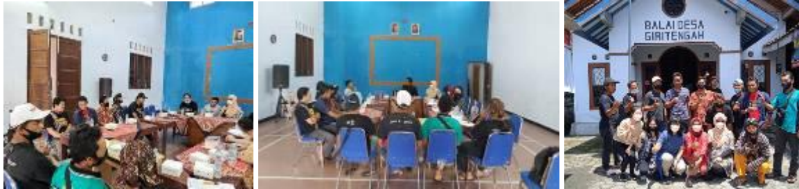
Gambar 7. Kegiatan Focus Group Discussion dengan warga Desa Giritengah

Pengembangan kegiatan wisata desa Giritengah ke depannya memerlukan perencanaan yang matang. Pemerintah Desa bersama masyarakat perlu bersinergi untuk mewujudkannya. Dalam FGD yang dilakukan, terungkap permasalahan dan kendala yang dihadapi oleh warga desa dalam mewujudkan desa mereka sebagai desa wisata. Perlu dirumuskan solusi dari permasalahan yang dihadapi dengan duduk bersama antar semua pemangku kepentingan di Desa Giritengah.