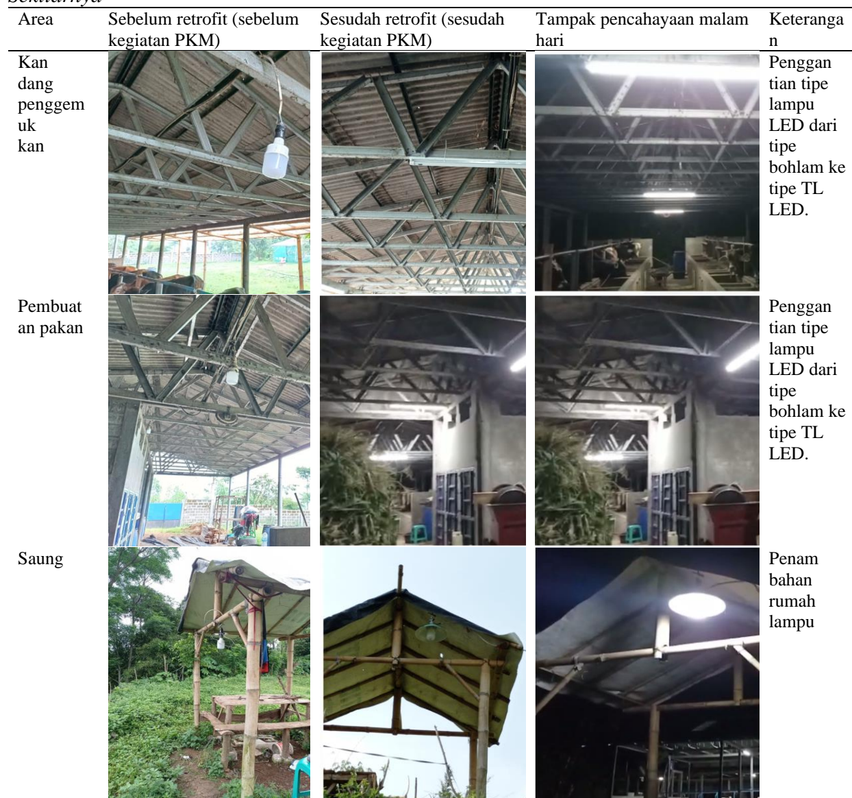
Penggunaan Tipe Lampu LED, Rumah Lampu dan Pencahayaan pada Area Kandang Sapi dan Sekitarnya