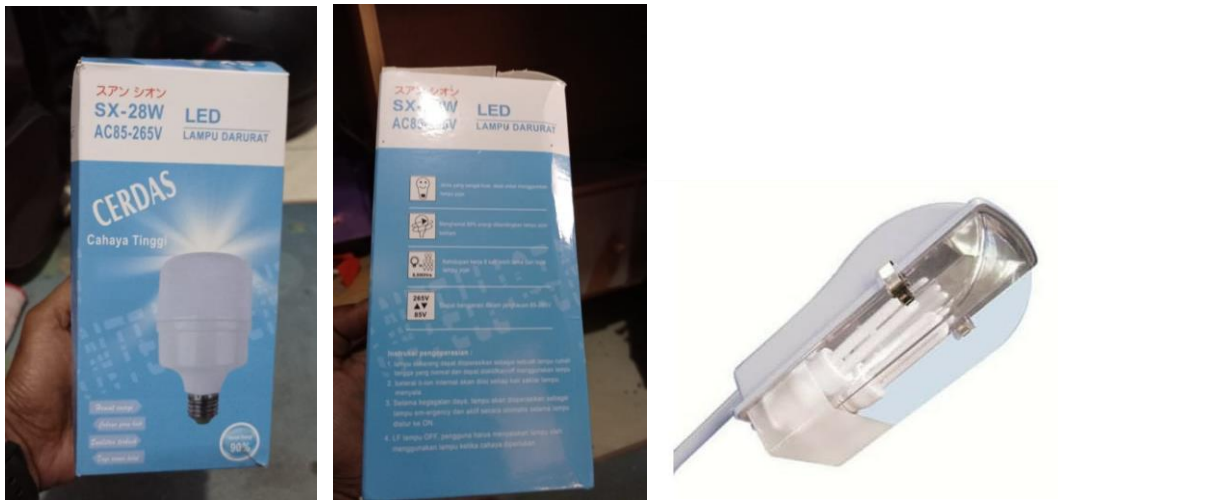
Bentuk Lampu LED Bohlam Sesuai Gambar, Spesifikasinya dalam Boks dan Bentuk Lampu untuk Jalan Sekitar