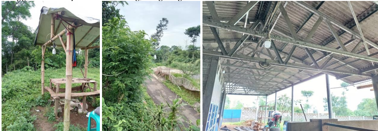
Penggunaan Lampu LED di Saung, Lingkungan dan Area Pembuatan Pakan