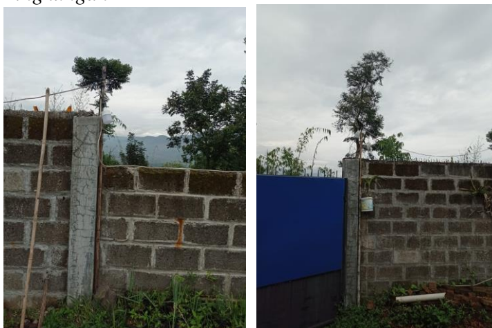
Penggunaan Lampu LED di Gerbang Kandang, Sekaligus Sebagai Pencahayaan Sekitar Jalan Lingkungan