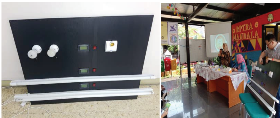
Gambar 4. Alat peraga dan penjelasan pemanfaatan sensor

Berdasarkan pengetahuan yang disampaikan kepada kader PKK Kelurahan Tomang ini, diharapkan persepsi ibu rumah tangga tentang pentingnya hemat energi akan berubah dan selanjutnya akan menerapkan perilaku hemat energi pada keluarganya. Disebutkan bahwa seseorang akan berperilaku hemat energi diawali dengan adanya pengetahuan dan niat berperilaku (Dewi, 2015). Berbagai cara dilakukan dalam pembekalan atau bimbingan teknis kepada para kader PKK di Kelurahan Tomang. Pertama, penyampaian informasi tentang peralatan elektronik rumah tangga, terutama peralatan yang rata-rata dimiliki oleh ibu rumah tangga. Kedua, penjelasan tentang hemat energi khusus lampu, yaitu menunjukkan lampu yang hemat energi, tanda-tanda bagaimana lampu hemat energi, yaitu adanya luaran cahaya lampu dalam satuan lumen, dan berapa daya (satuan watt) yang digunakan oleh lampu tersebut. Jika hasil bagi lumen terhadap daya yang disebut sebagai efisiensi tinggi, lampu tersebut hemat energi. Jadi, para kader PKK dapat membandingkan beberapa lampu yang dijual di toko-toko. Selain itu, melalui alat peraga ditunjukkan bahwa saat ini sudah banyak lampu yang memiliki timer atau sensor, yang secara otomatis dapat mati, hidup, atau meredup sesuai dengan keinginan pengguna. Alat peraga tersebut seperti pada Gambar 4.