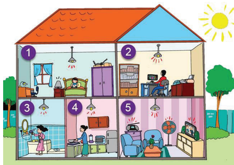
Gambar 2. Peralatan listrik yang umum untuk rumah tangga (Utama, 2019)

Sesuai dengan materi yang disampaikan oleh salah satu narasumber dalam kegiatan PKM ini, hemat sama dengan pakai seperlunya. Jadi, hemat energi listrik berarti pakai listrik seperlunya. Disebutkan bahwa energi listrik merupakan daya listrik dikali waktu pemakaian, sementara biaya pemakaian listrik merupakan energi listrik dikali dengan tarif dasar listrik/TDL (Utama, 2019; EECCHI, 2014). Dalam hal ini hemat energi dapat bermakna hemat listrik, yang dimaksudkan sebagai ikut berpartisipasi/melaksanakan program pemerintah. Hemat energi juga dapat dimaksudkan mengurangi pengeluaran biaya rumah tangga dan memanfaatkan untuk kebutuhan lainnya.