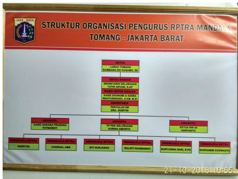
Gambar 1. Susunan organisasi RPTRA Mandala Kelurahan Tomang

Anggota TP PKK adalah siapa saja, baik laki-laki maupun perempuan yang tergerak untuk memberikan sebagian waktunya untuk berbagai kegiatan yang bermanfaat, dan siap untuk tidak menerima upah/gaji. Sasaran PKK adalah keluarga, terutama ibu rumah tangga, seseorang yang berperan sangat penting dalam keluarga. Kegiatan yang dilakukan kader PKK Kelurahan Tomang antara lain memberikan penyuluhan kesehatan, pemantauan pertumbuhan anak balita, dan sosialisasi program-program pemerintah dalam kaitannya dengan keluarga.