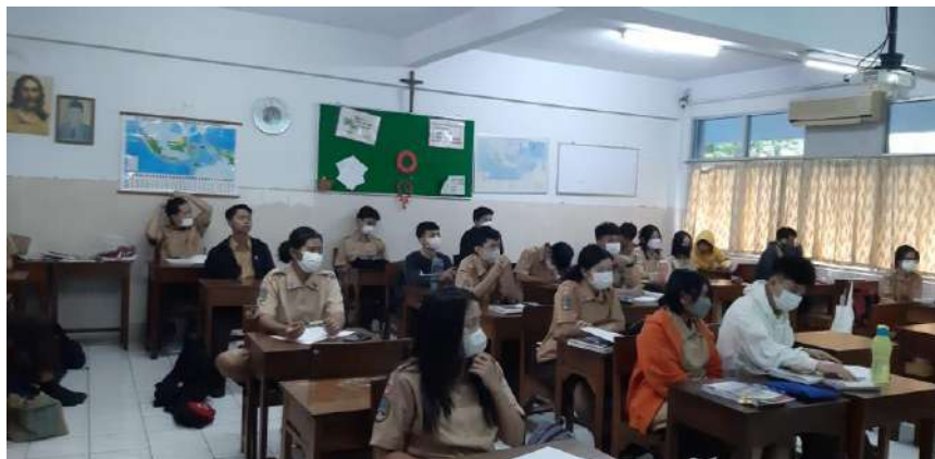
Gambar 2. Foto Siswa Kelas 12 IPS

memiliki rekam jejak utama laporan keuangan, dan bisa memberikan petunjuk terhadap aktivitas transaksi yang ganjil atau tidak biasa. Buku besar ini disebut general ledger. General ledger berisikan ringkasan dari transaksi selama satu periode atau satu bulan. Biasanya neraca saldo dibuat pada akhir periode akuntansi. setiap akun disusun menurut urutannya dalam buku besar, saldo debit diletakkan pada kolom kiri dan saldo kredit diletakkan pada kolom kanan. Neraca saldo secara matematis akan membuktikan jumlah debit dan jumlah kredit akan sama setelah posting. Tujuan pembuatan Neraca Saldo adalah untuk menguji kesamaan debit dan kredit di dalam buku besar dan mempermudah penyusunan laporan keuangan. Tahap ini merupakan awal persiapan pembuatan laporan keuangan