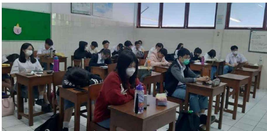
Gambar 1. Foto Kegiatan PKM pada SMA Bunda Hati Kudus

Dosen Fakultas Ekonomi dan Bisnis Jurusan Akuntansi Universitas Tarumanagara (UNTAR) memberikan pembekalan pengetahuan seputar Sistem Akuntansi Dasar kepada para siswa/i SMA Bunda Hati Kudus yang berada di Jl. Rahayu No 22, Jelambar, Kota Jakarta Barat. Kegiatan pembekalan ini diberikan secara luring yang dilaksanakan dengan dua hari, hari pertama dilaksanakan pada tanggal 1 Maret 2023 dari pukul 12.45-14.00 dan hari kedua dilaksanakan pada tanggal 21 Maret 2023 dari pukul 06.45-08.00 secara offline yang dikemas dalam bentuk presentasi dan sesi tanya jawab. Pelatihan ini diikuti oleh 2 kelas yaitu kelas XI IPS 1 dan XI IPS 2 dengan masing-masing total siswa/i berjumlah 30 dalam kelas. Selanjutnya, untuk sesi tanya jawab dilakukan dengan harapan dapat memperjelas materi bahasan serta mengevaluasi pemahaman para peserta atas materi yang telah dipaparkan sebelumnya. Kegiatan ini ditampilkan pada Gambar 1.