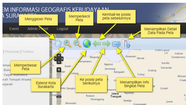
Gambar 1: Tampilan Navigasi Peta