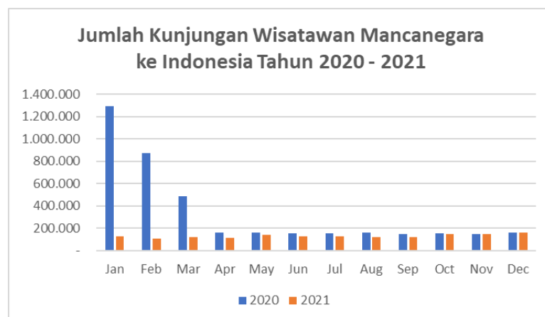
Gambar 1.3. Jumlah Kunjungan Wisatawan Mancanegara ke Indonesia Tahun 2020 – 2021

Dari Gambar 1.2 terlihat bahwa jumlah kunjungan wisatawan mancanegara ke Indonesia mengalami penurunan pada tahun 2020. Penurunan ini sangat kontras jika dibandingkan dengan tren peningkatan pada dua tahun sebelumnya.