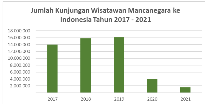
Gambar 1.2. Jumlah Kunjungan Wisatawan Mancanegara ke Indonesia Tahun 2017 – 2021

terhadap sektor pariwisata dan perhotelan, dampak langsung dari kurangnya kunjungan wisatawan selama pandemi Covid-19 juga mempengaruhi secara negatif pendapatan bisnis restoran (Hanoatubun, 2020).