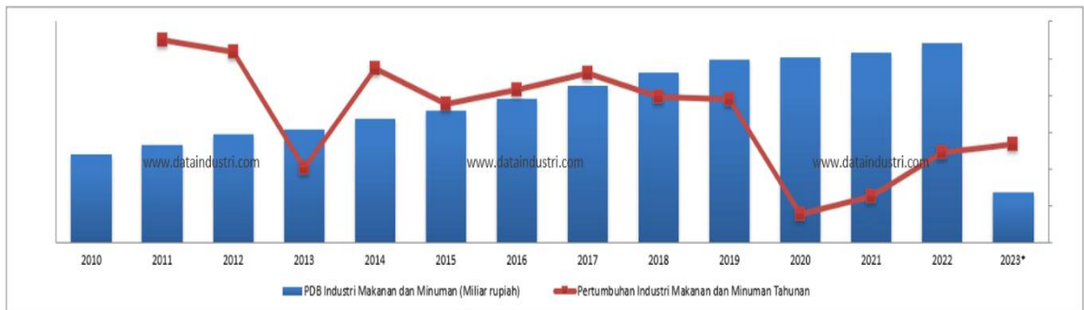
Gambar 1.1 Grafik Pertumbuhan Industry Makanan dan Minuman

Dapat dilihat dari gambar 1.1 diatas, terdapat fenomena pertumbuhan industri makanan dan minuman pada tahun 2021 hingga tahun 2023. Berbeda di tahun 2020 yang dimana industri food and beverage mengalami penurunan drastis. Hal tersebut dikarenakan adanya kondisi pandemi covid-19.