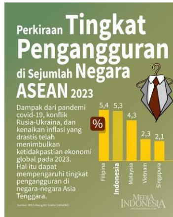
Gambar 1. 1 Proyeksi Jumlah Pengangguran di Beberapa Negara ASEAN 2023