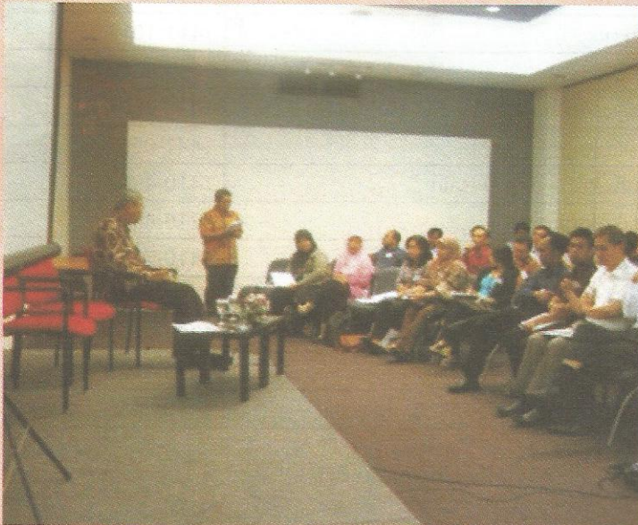
Diskusi Quality Assurance di Pendidikan Tinggi diselenggarakan oleh Konsultan PQM.